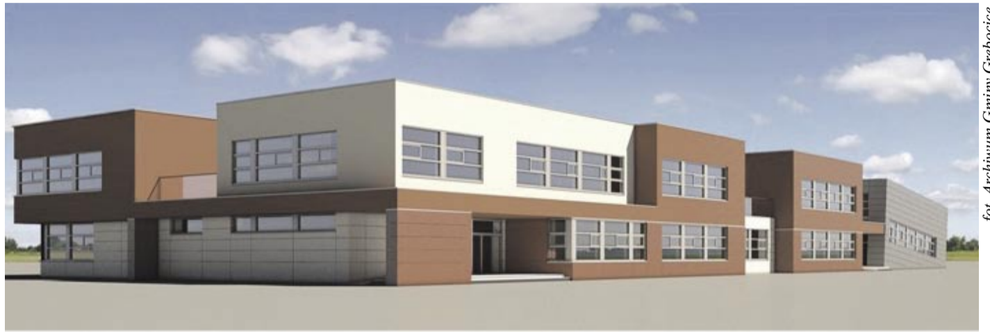
Już po projekcie widać, że nowe gimnazjum w Grębocicach będzie prezentować się okazale i nowocześnie.

Największym przedsięwzięciem jest – rozpoczęta w styczniu – budowa nowego gimnazjum w Grębocicach. Szkoła nosi imię Jana Nowaka Jeziorańskiego, a samorządowcy zapewniają, że obiekt będzie godny swojego patrona, wielkiego Polaka i patrioty. Wewnątrz dwukondygnacyjnego budynku znajdzie się zadaszne atrium oraz kilka stref odpoczynku dla uczniów (w tym 165 m kw. tarasów), biblioteka z czytelnią oraz świetlica z zapleczem i antresolą. Według projektu całkowita powierzchnia szkoły wyniesie 5075,41 m kw. Inwestycja, wyceniona na ponad 14 mln 165 tys. zł, będzie sfinansowana z budżetu gminy.