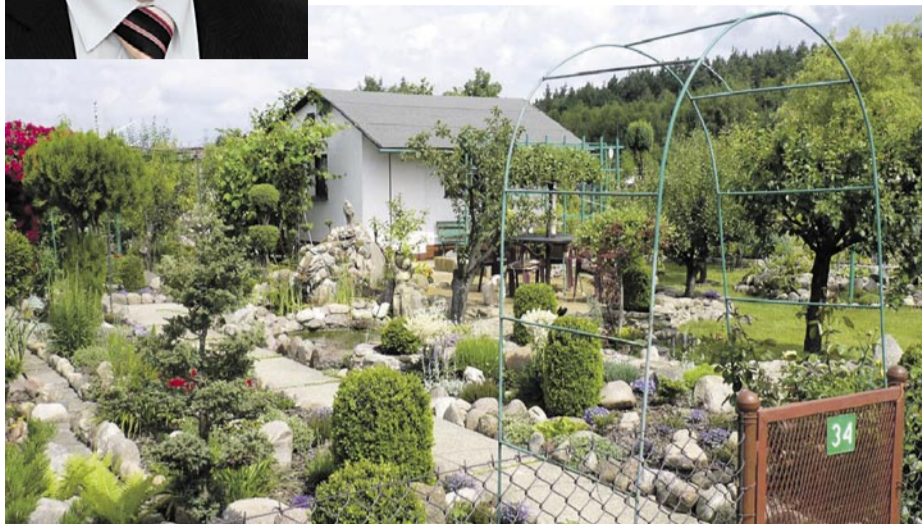
„Miedzianka” nawet z daleka cieszy oko.