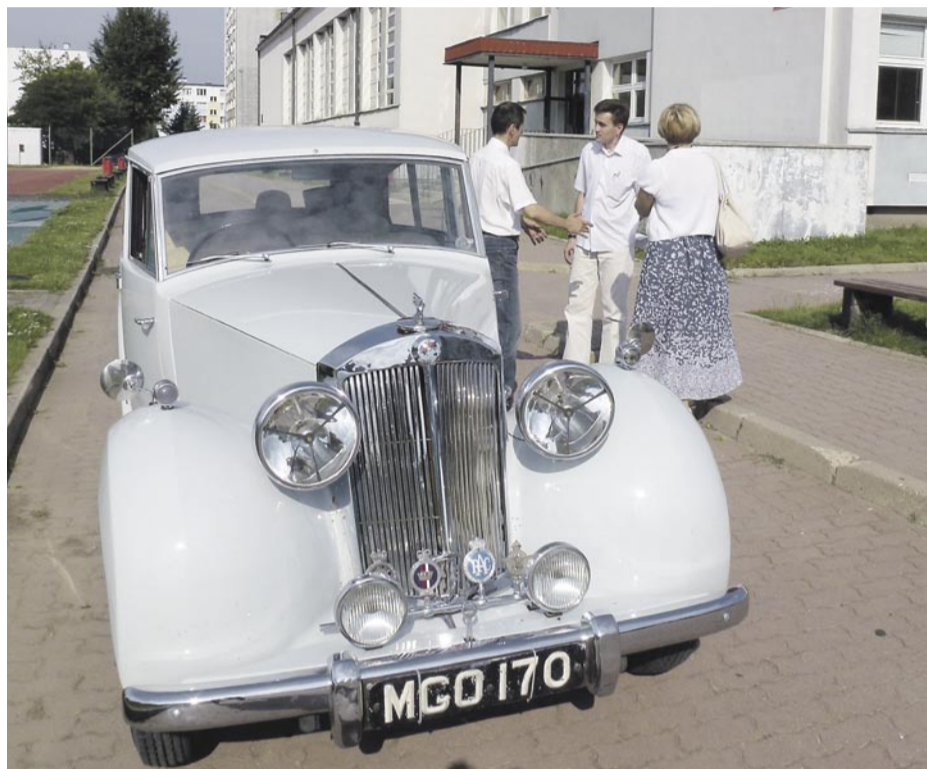
Oto Triumph Renown z 1947 roku, który będzie można zobaczyć w Polkowicach już 17 września.