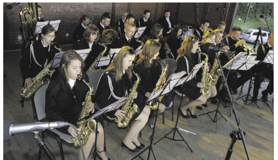
Orkiestra Dęta Ochotniczej Straży Pożarnej Kwielice.