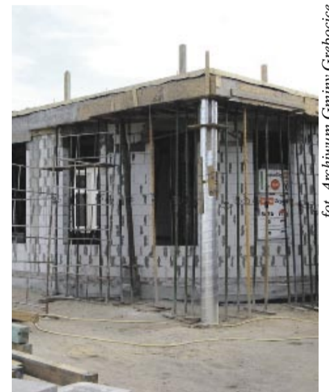
Mieszkańcy Rzeczycy będą mogli cieszyć się z nowej przyszkolnej biblioteki już w listopadzie br.

Boisko ma być gotowe w połowie października br., choć jego walory w pełni będziemy mogli podziwiać przyszłą wiosną – gdy już urosnie na nim murawa. Tymczasem jeszcze przed nastaniem kalendarzowej zimy do użytku ma zostać