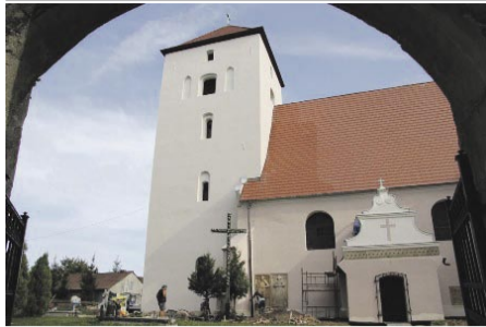
Siedemnastowieczny kościół w Szymocinie odzyskuje dawny blask.