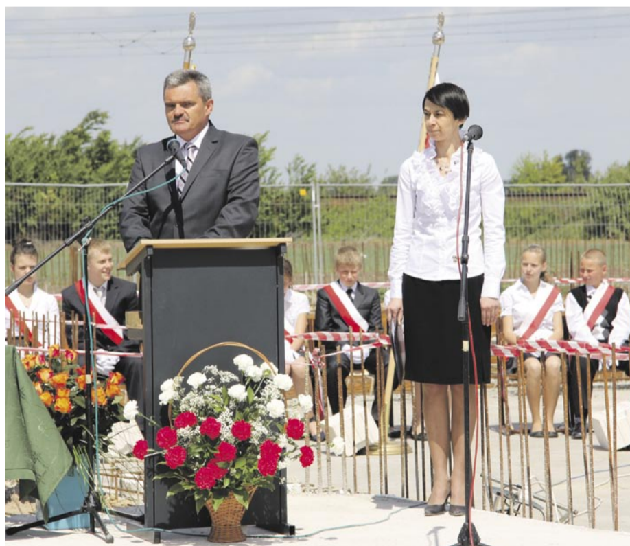
Akt erekcyjny pod budowę gimnazjum wmurowano pod koniec maja br.

Roboty budowlane tego lata nie ominęły również innych miejscowości. 14 lipca w Retkowie ruszyła budowa drogi. Za 110 tys. zł Spółdzielnia Obsługi Rolnictwa „Farmer” ma drogę odnowić i wyłożyć drogę kostką. Prace potrwać do 5 września. Przed planowanym terminem natomiast zakończono kompleksowy remont świetlicy w Buczach. Od 5 sierpnia mieszkańcy tej wsi mogą spotykać się i spędzać wolny czas w odnowionych wnętrzach obiektu. Głogowski „Modernopol” wykonał również elewację na zewnątrz. Inwestycja kosztowała ponad 147 tys. 800 zł. (embe)