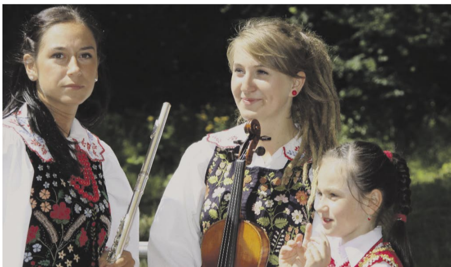
...pięknie grały zachwycając urodą.