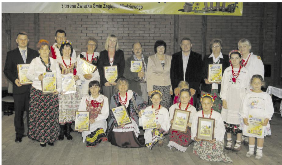
Przedstawiciele zespołów biorących udział w festiwalu.