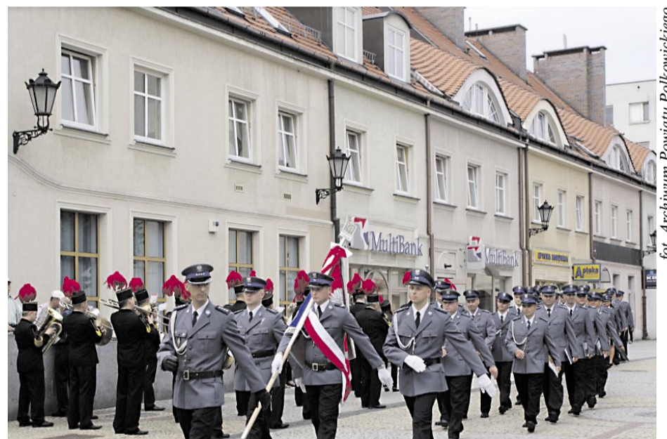
fol. Archiwum Powiatu Polkowickiego