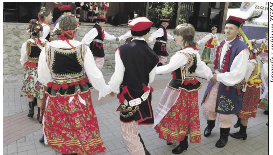
Jaczowiacy w tanecznym korowodzie.