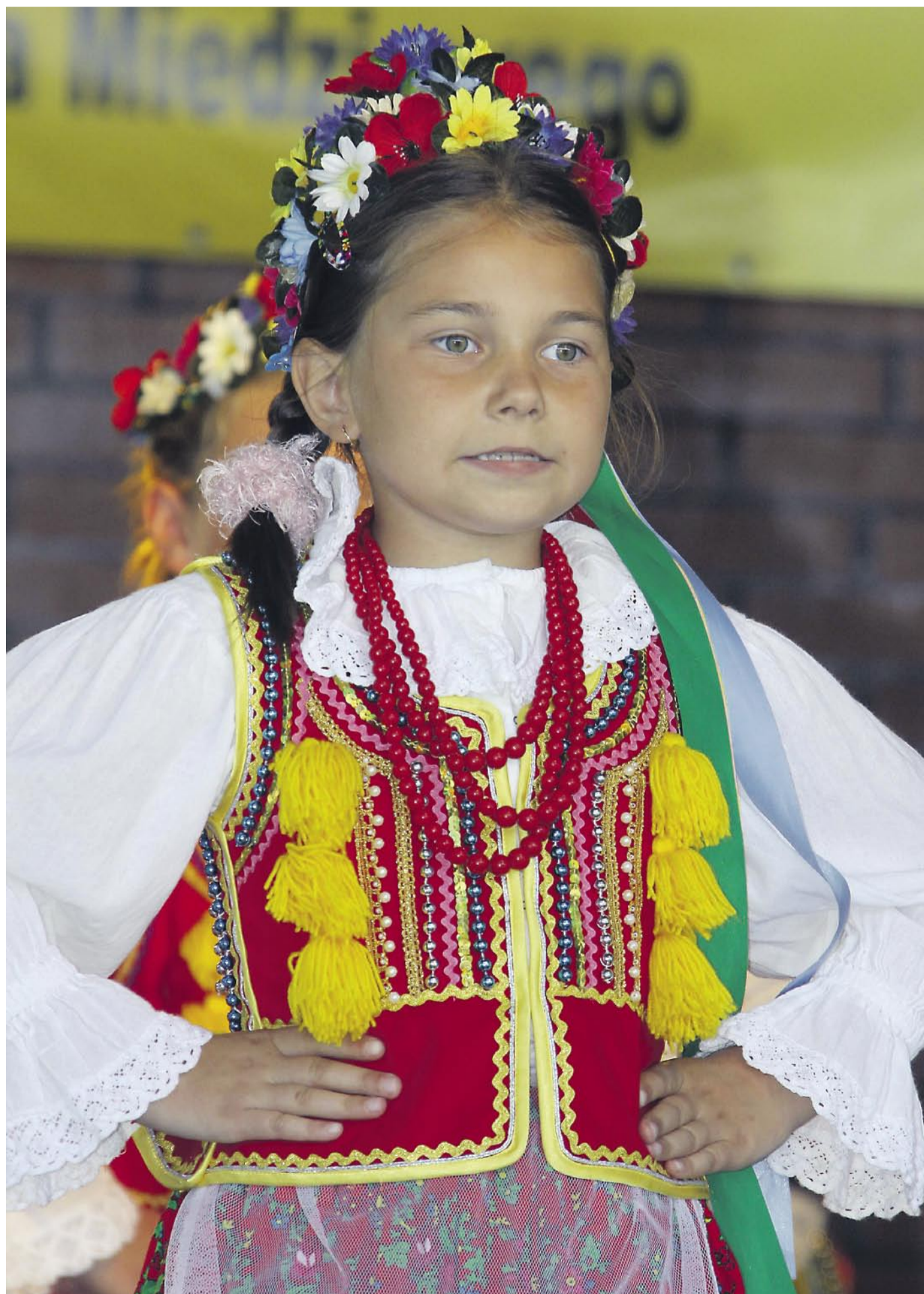
Festiwal kapel i orkiestr dętych już za nami (fotorelacja > str. 5)