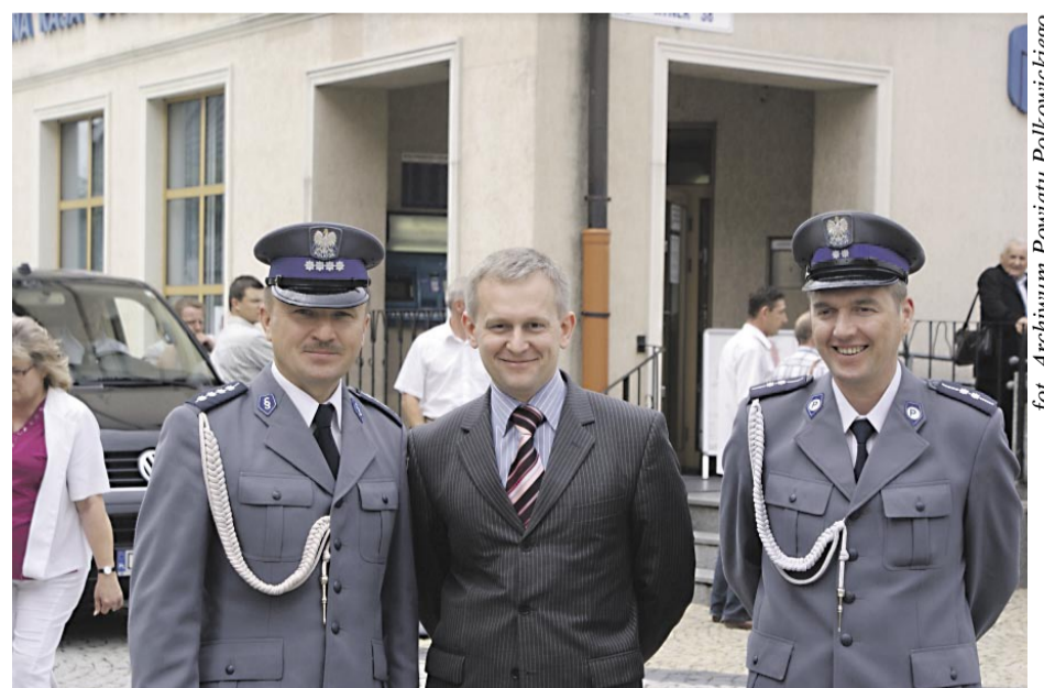
fol. Archiwum Powiatu Polkowickiego