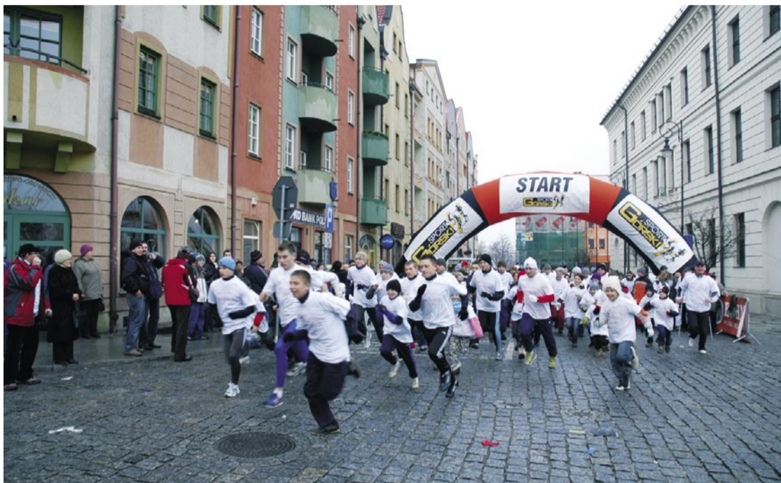
Jubileuszowy marszobieg rozpocznie się 1 stycznia 2013 r. o godz. 14.00 na głogowskim rynku.