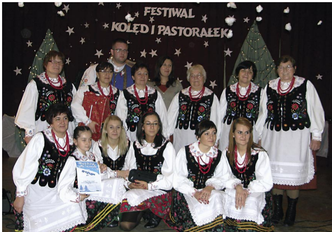
„Podolanki” – zwycięzcy w jednej z festiwalowych kategorii.