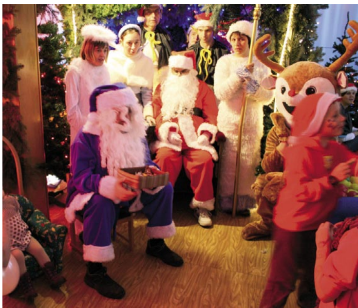
Święty Mikołaj obdarowywał wszystkich słodyczami.