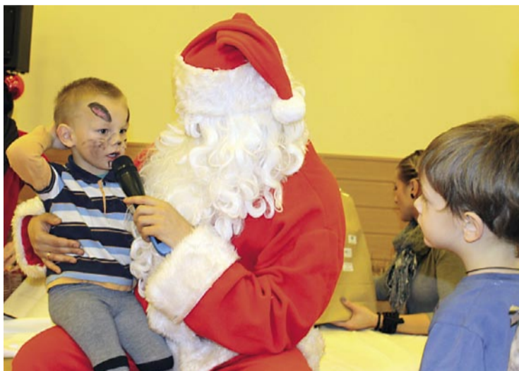
Wszystkie dzieci otrzymały od świętego Mikołaja torby z prezentami.

Dzieci nie musiały długo czekać na odwiedzinę świętego. Pojawił się, gdy tylko maluchy wspólnymi siłami go zawołały. Tam gdzie był Mikołaj, nie mogło zabraknąć też prezentów. Wszyscy wychowankowie rodzin zastępczych otrzymali paczki z upominkami. Każde dziecko mogło liczyć nie tylko na prezent, ale i ciepłe słowa od świętego Mi-