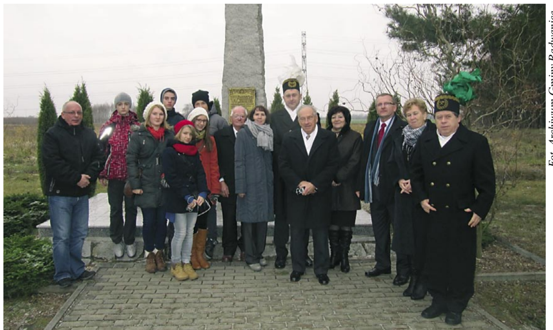
Uroczystości dopełniło złożenie wieńców pod obeliskiem Jana Wyżykowskiego w Sieroszowicach.