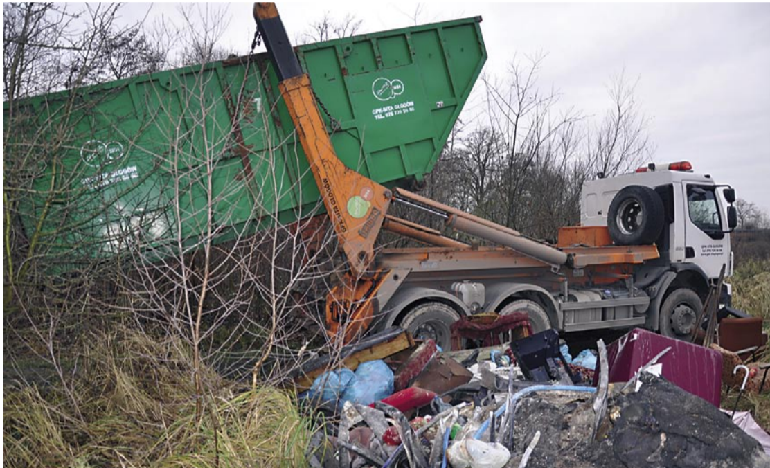
Roszarnia w Radwanicach przed stu laty dawała pracę ponad 200 osobom. Zakład popadł w ruinę, na której mieszkańcy dawno temu zrobili nielegalne wysypisko.