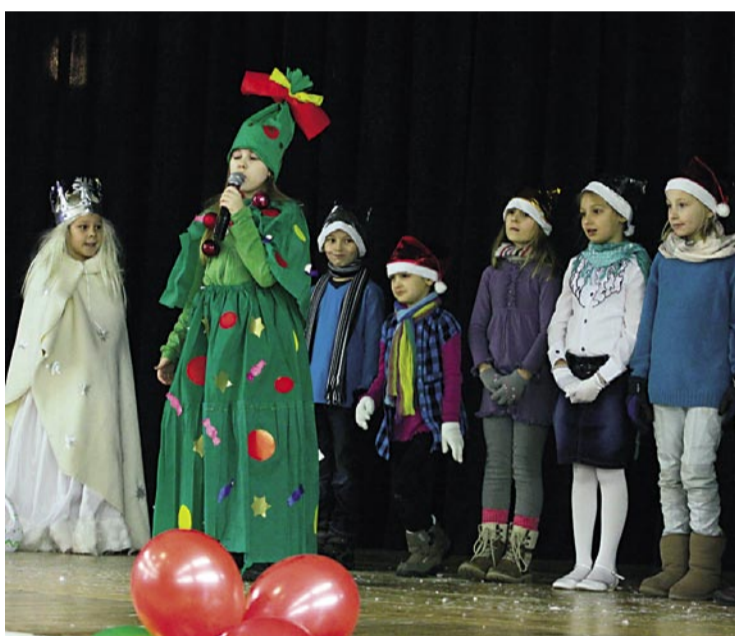
Dzieci z SP 3 przygotowały piękny program artystyczny.