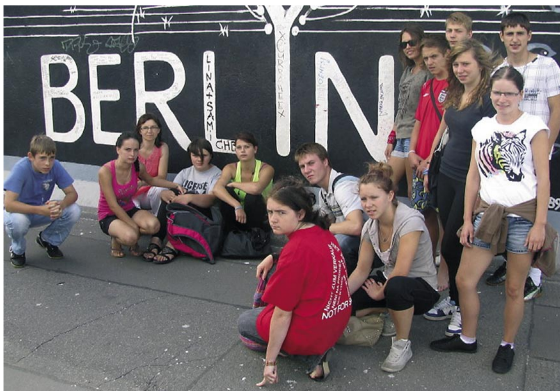
Podopieczni placówki wyjechali między innymi do Berlina.

W ramach działań ekologicznych powiat polkowicki wsparł Placówkę Socjalizacyjną „Skarbek” w Polkowicach kwotą 26 tysięcy złotych. Dodatkowe 8 tysięcy przekazał Wojewódzki Fundusz Ochrony Środowiska i Gospodarki Wodnej. Dzięki tym środkom wychowankowie placówki mogli uczestniczyć w wielu zajęciach terenowych, dzięki którym wzrastała ich świadomość ekologiczna. W tym roku zwiedzili na przykład Góry Orlickie, Karkonosze, Park Krajobrazowy czy w Gołuchowie.