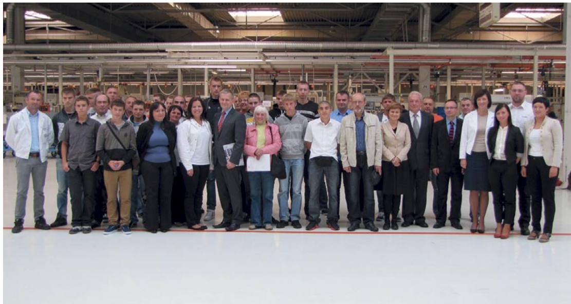
Uczniowie Zespołu Szkół w Chocianowie wraz z rodzicami, przedstawicielami załogi oraz starostwa powiatowego tuż po spotkaniu inauguracyjnym nowego roku szkolnego.

Zespół Szkół w Chocianowie od siedmiu lat współpracuje z Volkswagen Motor Polska w zakresie kształcenia zawodowego. Początkowo polkowicka fabryka światowego koncernu motoryzacyjnego przyjmowała czwórkę uczniów. W tym roku jest ich 15. To najlepsi z najlepszych. Aby znaleźć się w klasie, która umożliwia odbycie praktyk, musieli przejść specjalne egzaminy. We wtorek mieli okazję przyrzec się z bliska jak wygląda praca w Volkswagencie, a także usłyszeć, jakie wynikają z tego korzyści. A tych rzeczywiście jest wiele.