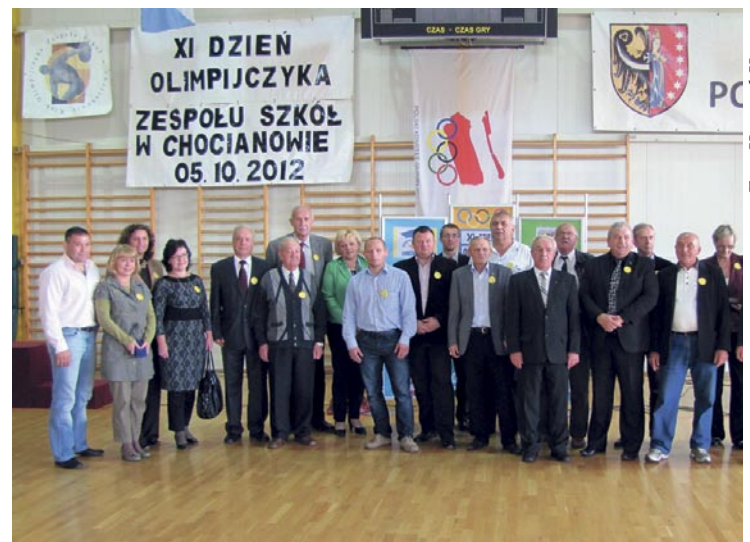
Pamiątkowe zdjęcie uczestników ubiegłorocznego Dnia Olimpijczyka. W tym roku także do Chocianowa przyjedzie wielu znakomitych sportowców.