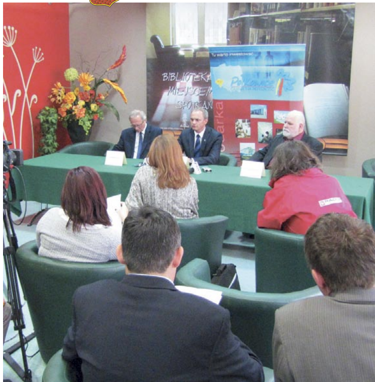
Konferencja prasowa przyciągnęła wielu dziennikarzy.