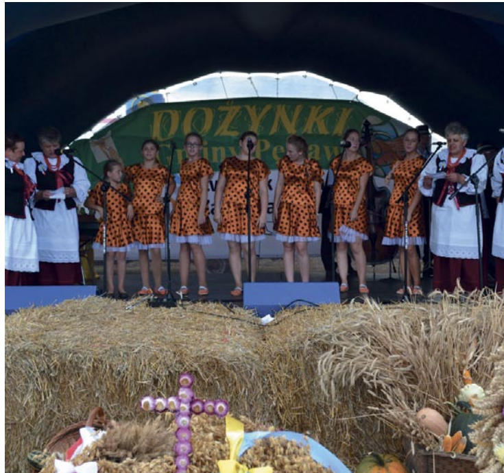
Kolejne pokolenie Pęcławianek na scenie

Tegoroczne dożynki odbyły się w Białogórze. Na boisku sportowym ustawiono scenę, tam też mieszkańcy mogli obejrzeć pokaz walk rycerskich grupy SWAR, obrzęd „swatów”, posmakować lokalne produkty,