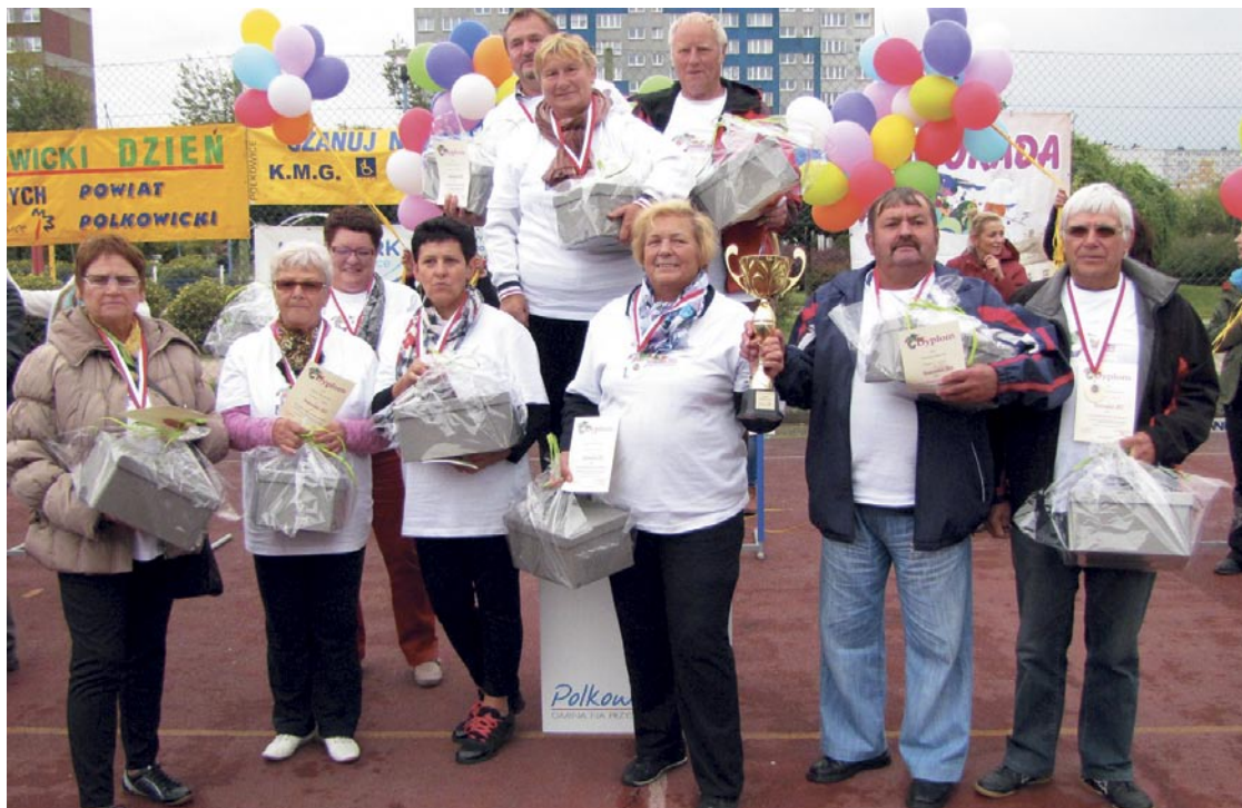
Ekipa Stowarzyszenia Emerytów i Rencistów byłych pracowników KGHM była bezkonkurencyjna.