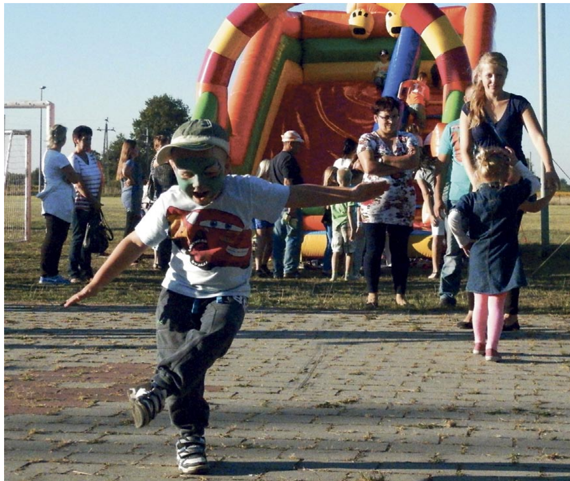
To się nazywa rozrywka!

W niesamowitej atmosferze spędzili słoneczne popołudnie dzieci i rodzice, którzy pojawili się w sobotę 7 września na terenach zielonych przy Szkole Podstawowej w Szklarach Dolnych. Na Piknik Rodzinny mieszkańców zaprosiły Stowarzyszenie Szklary Dolne Kraina Nadziei oraz Ochotnicza Straż Pożarna Szklary Dolne, a atrakcje zapewniały lokalne firmy: Park Rozrywki Słoneczny Raj oraz Jazda Konna i Hipoterapia Promyk. O atmosferę podczas festynu zadbał też zespół „Demo”. Smakosze mogli skosztować kielbaski