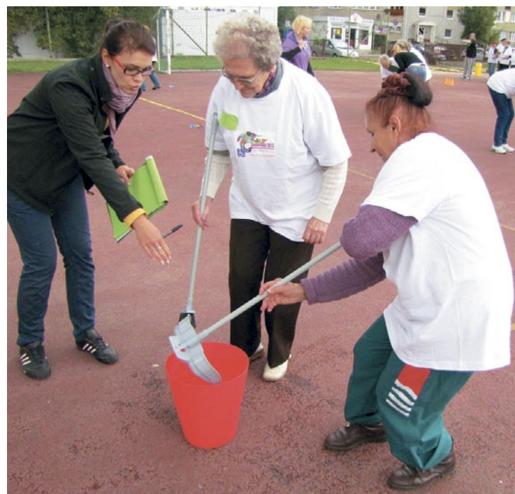
Podczas konkursowych konkurencji trzeba było wykazać się szybkością i precyzją.

W środę 18 września w auli Dolnośląskiej Wyższej Szkoły Przedsiębiorczości i Techniki w Polkowicach spotkali się specjaliści od zagrożeń, jakie czipają na nas w internecie. Powodem ku temu była konferencja „Uczeń, rodzic, szkoła w obliczu zagrożeń cyberprzestrzeni”.