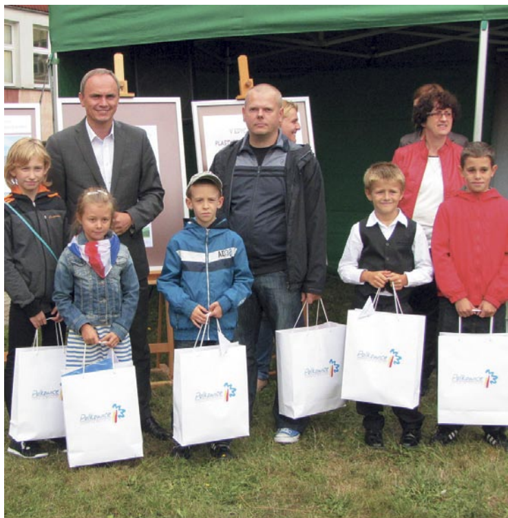
Laureaci konkursu plastyczno-fotograficznego „Sposób na energię odnawialną” z burmistrzem Polkowic Wiesławem Wabikiem”.