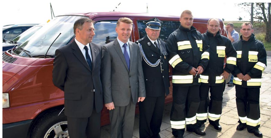
Volkswagen przyjechał do gminy Żukowice 3 września.