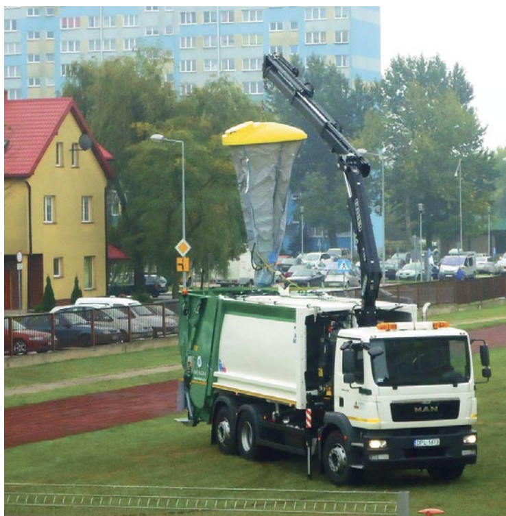
Ilustracją wykładu szefa ZGZM była prezentacja wozu do opróżniania podziemnych pojemników na odpady.