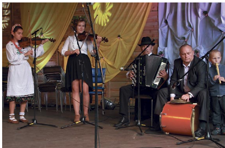
Kapela „Mała Dywidenka”.