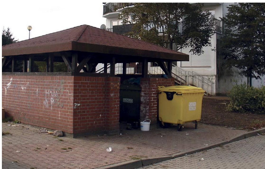
Takie stare ceglane boksy również na osiedlu Hubala zostaną zastąpione podziemnymi.