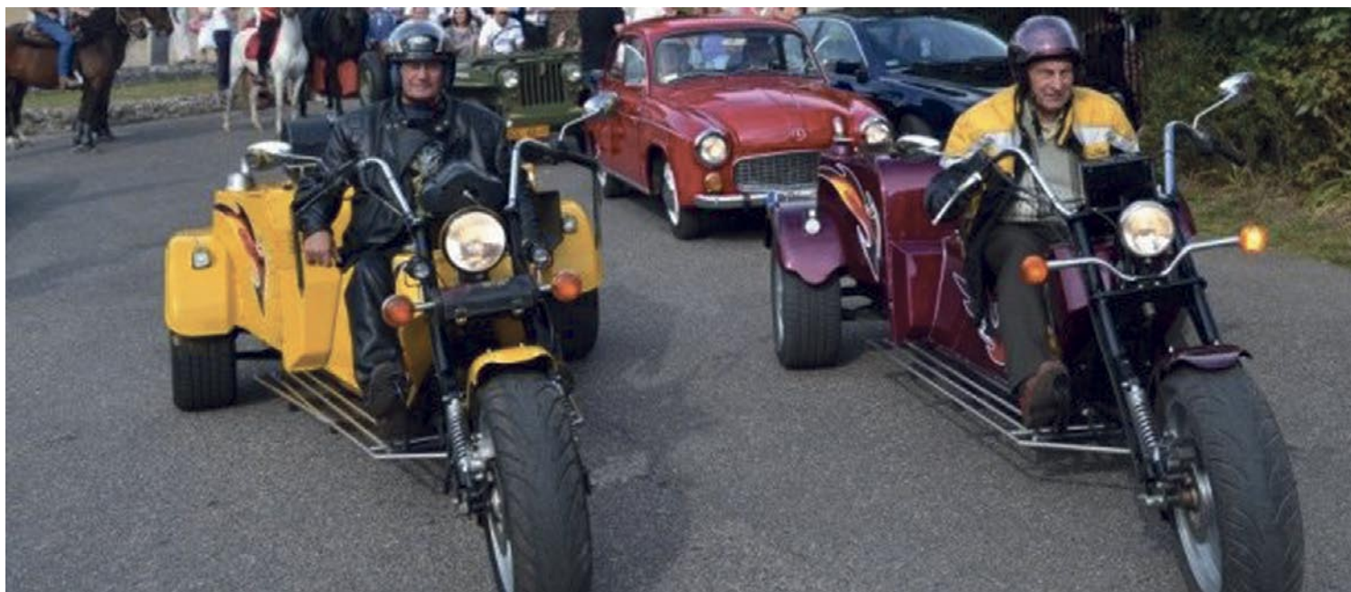
Jako pierwsi spod sanktuarium na swych motorach wyruszyli harleyowcy, następnie młodzi jeźdźcy z okolicznych stadnin koni.

Mieszkańcy i pielgrzymi zyskali ładne miejsce.