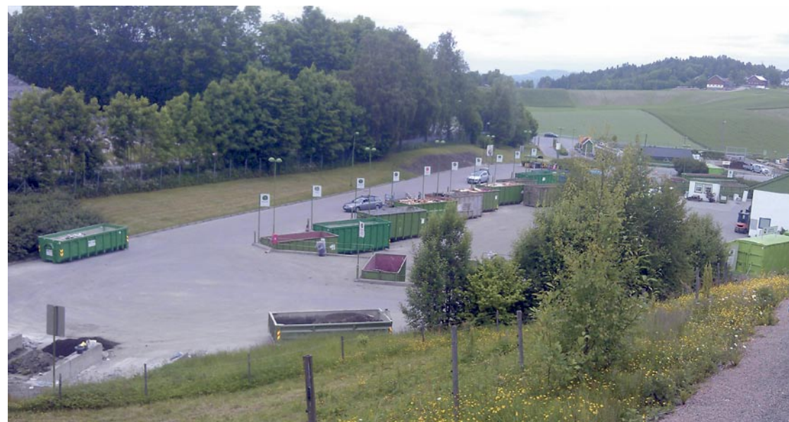
Tak wygląda centrum recyklingu w Drammen.