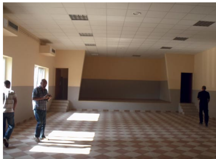
W świetlicy w Jakubowie roboty budowlane trwały całe wakacje.