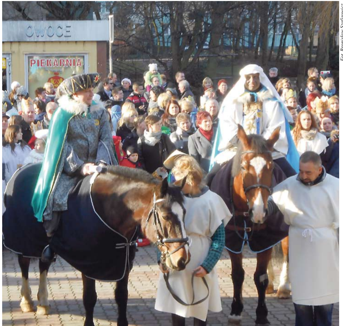
Orszak Trzech Króli był bardzo barwny.

„Dwuwyznaniowe kolędo- wanie w Guzicach” ..... str 15