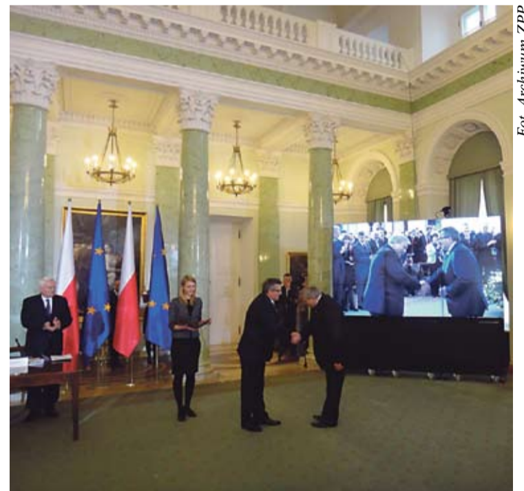
Marek Tramś zasiada w kapitule oceniającej i rekomendującej prezydentowi wnioski o Nagrodę Obywatelską. Na zdjęciu starosta odbiera podziękowania z rąk prezydenta RP Bronisława Komorowskiego.