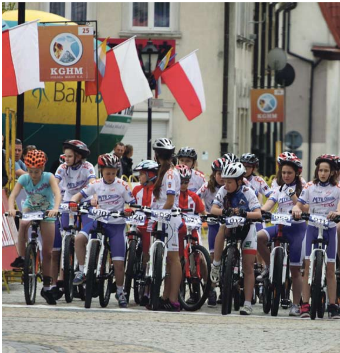
Młodzi kolarze z MTB Obiszów ścigają się w wielu wyścigach.

W listopadzie ubiegłego roku zainaugurowano działalność szkółek kolarskich MTB Obiszów TEAM w szkołach na terenie trzech gmin: Grębocice, Głogów i Jerzmanowa. To pierwszy w Polsce program treningowy dla dzieci i młodzieży. O tym, że jest to ważna inicjatywa świadczą choćby fakt, że swój patronat na przedsięwzięciu roztoczył Polski Związek Kolarski w ramach Narodowego Projektu Rozwoju Kolarstwa. W szkołach podstawowych i gimnazjach powstaną 8-osobowe drużyny kolarskie, które trenowane będą przez specjalnie