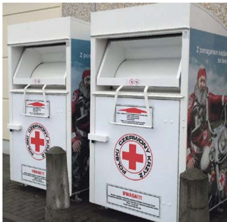
PCK postawi na terenie Związku w sumie 100 kontenerów na odzież.

Według propozycji podziału „odpadowego” rynku na terenie gminy Polkowice miałyby stanąć 117 pojemników na odzież, na terenie gminy Gawrzyce i Przemków – 85, w gminach Chocianów i Radwanice – 94, zaś w gminach Pęcław, Jerzmanowa i Grębocice – 102. Firmy, które wstępnie wyraziły chęć zajęcia się odbiorem starych ubrań, to: Tesso z Gdyni, Textyle ze Zgorzelca, Texland z Warszawy i „Wtórpol” ze Skarżyska-Kamiennej.