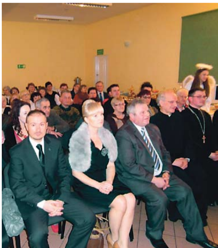
Zaproszeni na spotkanie goście wraz z wiernymi i organizatorami mieli okazję śpiewać i wysłuchać kolęd w języku polskim i ukraińskim.

Na skutek rozmaitych historycznych zawirowań Guzice stanowią obecnie małą ojczyznę zarówno dla rzymokatolików, jak i grekokatolików. Wyznawcy obu obrządków żyją ze sobą w pełnej symbiozie.