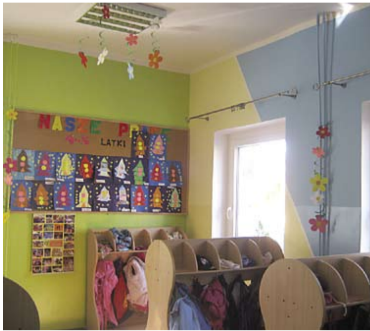
Nowa szatnia w Publicznym Przedszkolu nr 2 jest wesola i kolorowa.