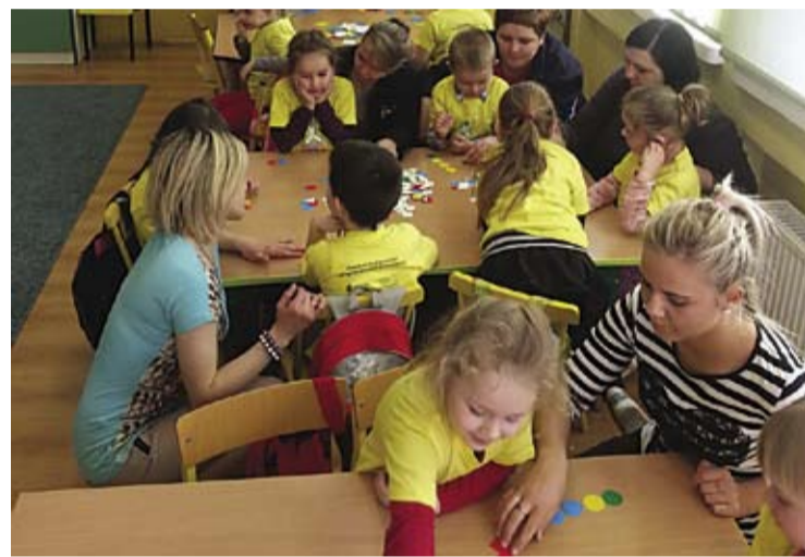
Rodzice i dzieci przy wspólnym rozwiązywaniu zadań.