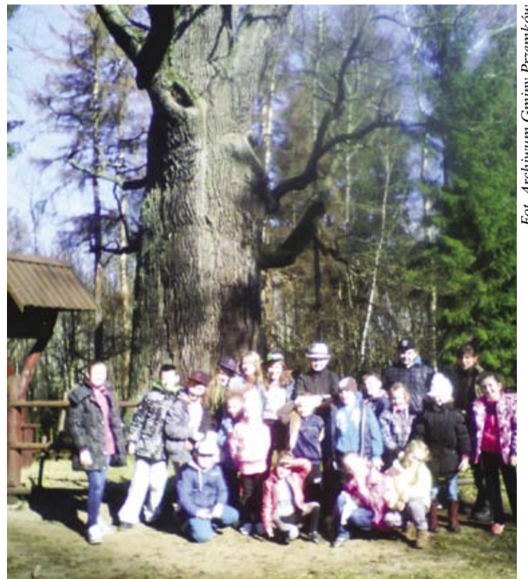
Jak widać, pogoda na wycieczkę do Piotrowic była wprost wymarzona.

Podczas marcowego wyjazdu uczniowie podziwiali i uczyli się rozpoznawać ptaki i ich głosy w okresie godowym. Ćwiczyli się w dostrzeganiu zmian, zachodzących w środowisku naturalnym zwierząt leśnych. Przeprowadzali eksperymenty, uświadamiające im, jak wielkie jest znaczenie wody w przyrodzie. Tworzyli prace plastyczne