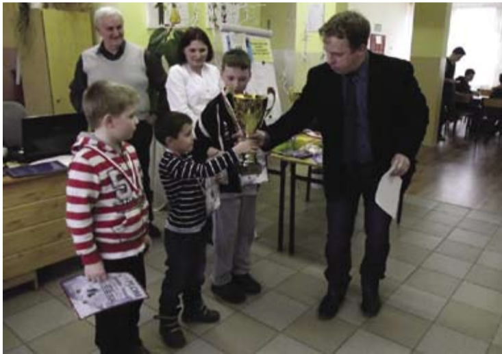
Najmniejszemu dostał się bynajmniej nie najmniejszy puchar.