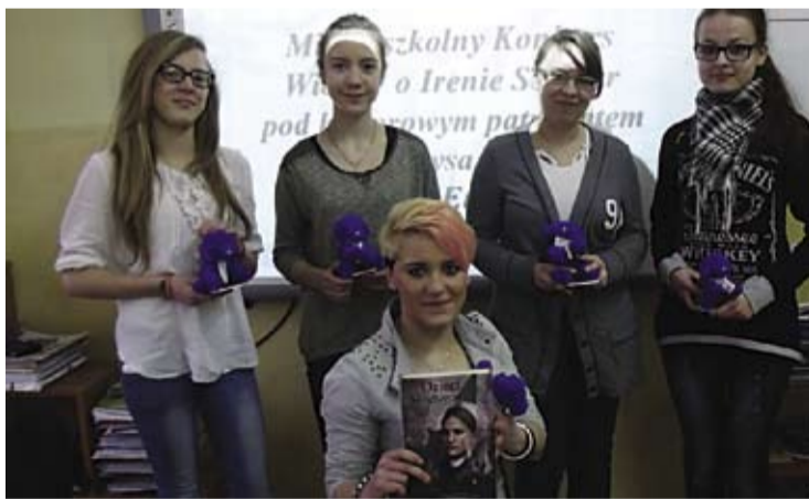
Laureatki konkursu w całej krasie.

W finale konkursu wzięły udział uczennice z Publicznego Gimnazjum, Liceum Ogólnokształcącego oraz Zasadniczej Szkoły Zawodowej w Przemko-