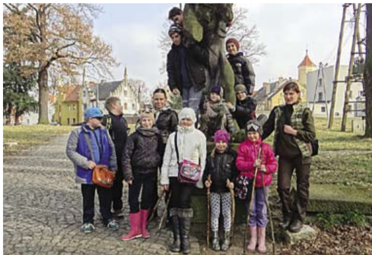
Pamiątkowe zdjęcie na zakończenie wycieczki w parku w Przemkowie. Trzeba przyznać, wcale oryginalna kompozycja.

„Aby zło zapanowało, wystarczy, aby ludzie dobrej woli wstrzymali się od czynu”.