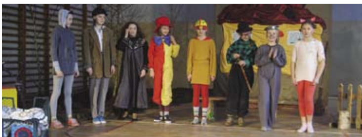
Młodzi aktorzy umiejętnie wcielili się w grane postacie.

14 lutego uczniowie SP nr 2 należący do koła teatralnego wystawili sztukę Izabeli Degórskiej „Bajka o szczęściu”. Ciepła, mądra i urocza baśń mówi o sile przyjaźni i miłości, które są cenniejsze od wszelkich dóbr materialnych. Spektaklowi towarzyszyła piękna muzyka Piotra Czajkowskiego, Modesta Musorgskiego oraz Edwarda Griega.