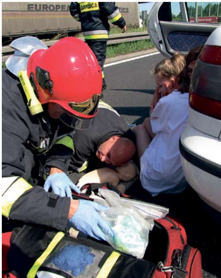
Strażacy stanęli na wysokości zadania.