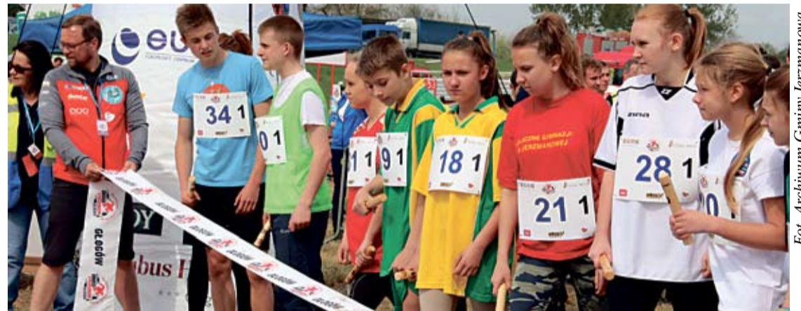
Sztafetowe Mistrzostwa Szkół, zorganizowane w ramach IV Crossu Straceńców, potwierdziły wysoką formę uczniów z gminy Jerzmanowa.

– Chcielibyśmy, aby stała się ona podręcznym narzędziem dla mieszkańców nie tylko naszej gminy, ale i sąsiednich, którzy zechcą zapoznać się z bieżącym serwisem informacyjnym, zawierającym opisy wydarzeń sportowych, lokalnych imprez, propozycji tras promujących aktywny wypoczynek.