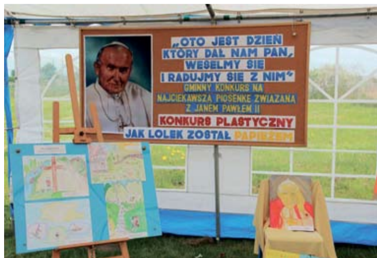
W specjalnym namiocie wystawowym prezentowano prace plastyczne uczniów szkół podstawowych i gimnazjum, wyróżnione w konkursie pn. „Jak Lolek został papieżem”.