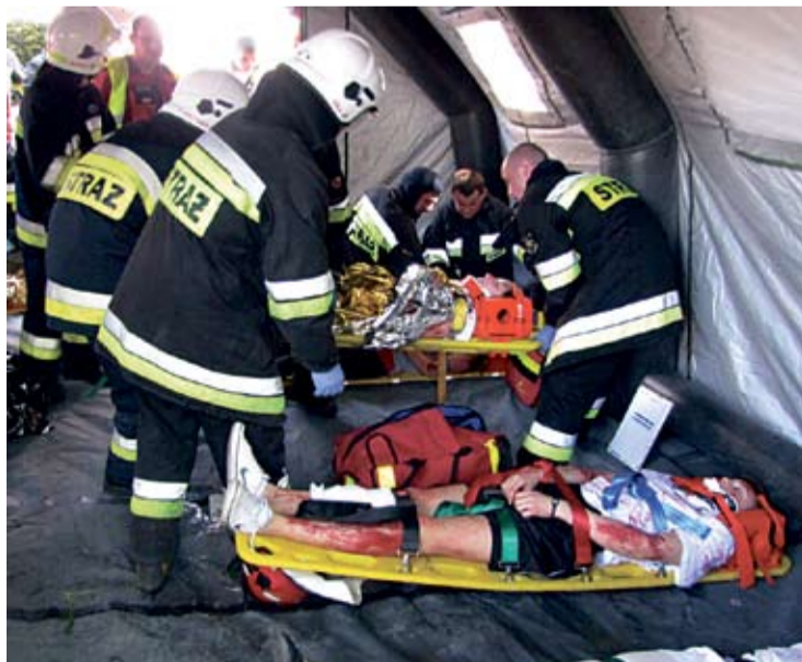
Poszkodowani znaleźli się w specjalnym namiocie.

W piątek (16.05) w polkowickim Rynku odbyła się wielka impreza strażacka. Setki dzieci skorzystały z możliwości obejrzenia strażackiego sprzętu oraz wielu innych atrakcji.