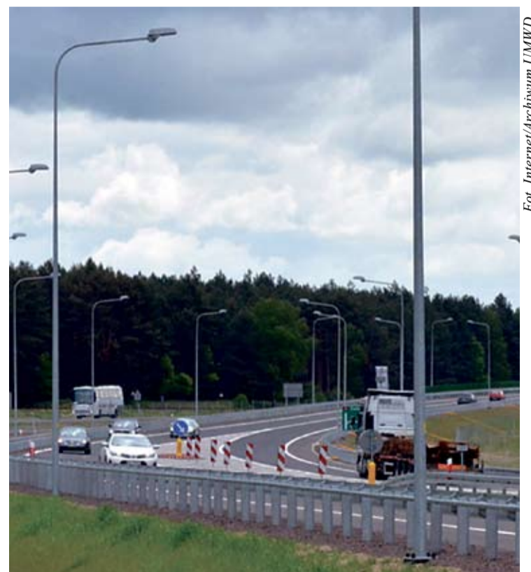
Budowa 37 kilometrów tego odcinka S3 kosztowała ponad 761 mln zł.