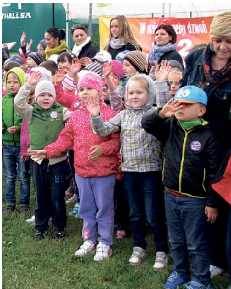
Strażomania to przede wszystkim duża frajda dla maluchów.

Potrawy zniwalające swoim smakiem, wspaniała atmosfera, a także świetna zabawa – tak w skrócie można opisać jubileuszową, 15. edycję Konkursu Kulinarnego na Najlepszą Potrawę Regionalną i Wypieki Ciast.