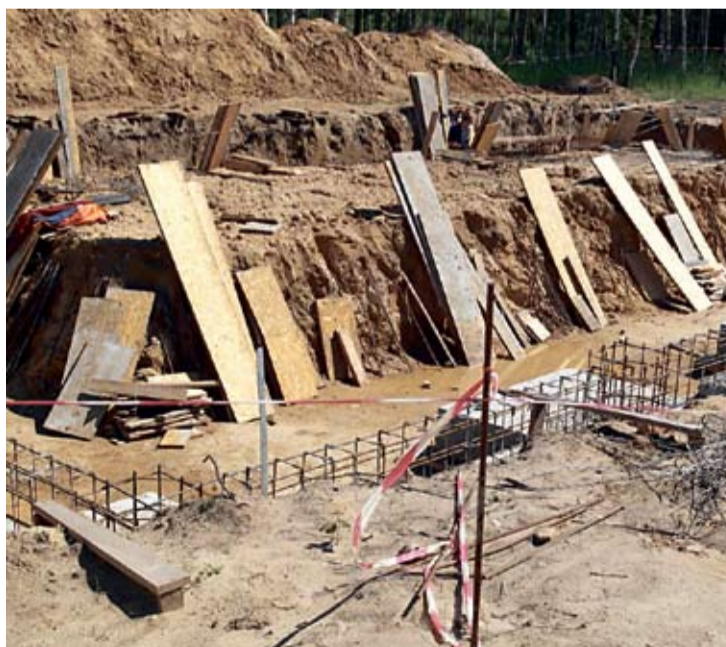
Prace przy przyszłej rampie.