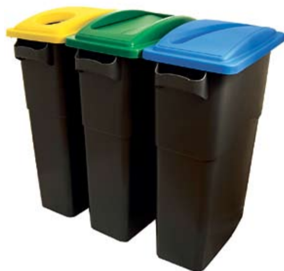
Takie zestawy trafią na szkolne korytarze.

Śmieciowy konkurs dla dzieci z gminy Pęcław.