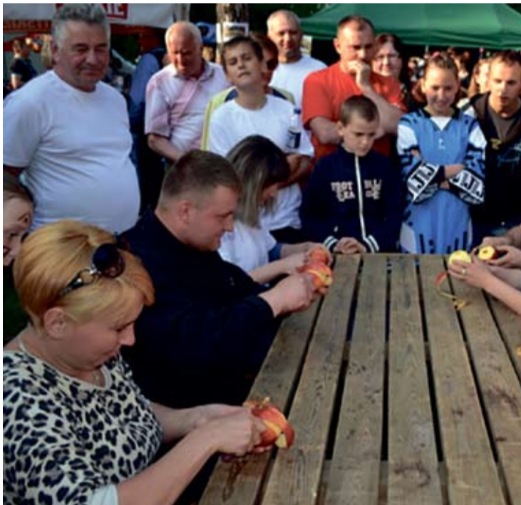
Miny przyglądających się mówią same za siebie: nietatwo obrać jabłko jednym ciągiem.