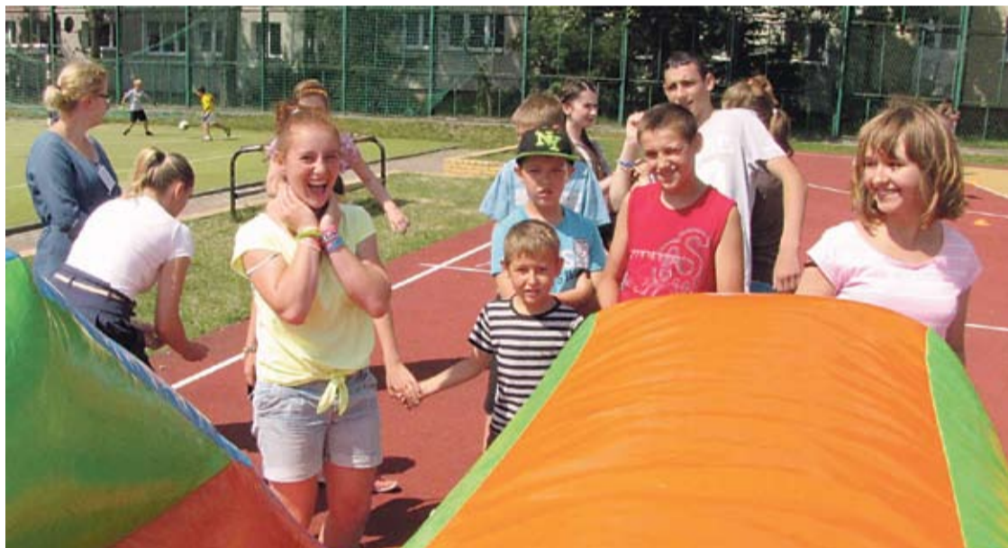
Uśmiechy gościły na twarzach uczestników zajęć od pierwszego do ostatniego dnia.