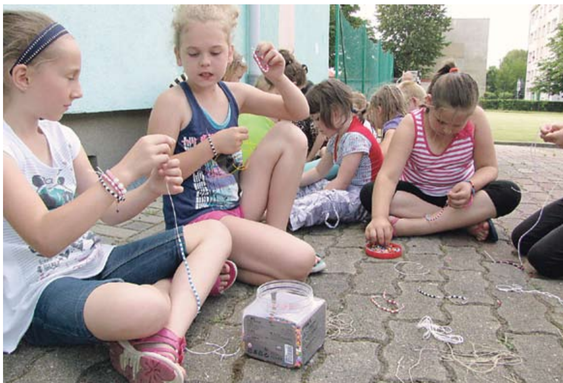
Przygotowywanie efektownych bransoletek było ciekawą propozycją dla dzieci.