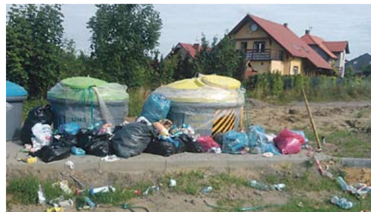
Ten punkt prawdopodobnie znajdzie się na czele listy miejsc, objętych monitoringiem.