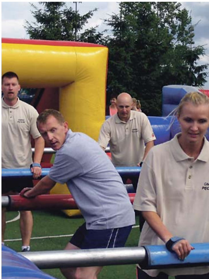
Reprezentacja gospodarzy w akcji.