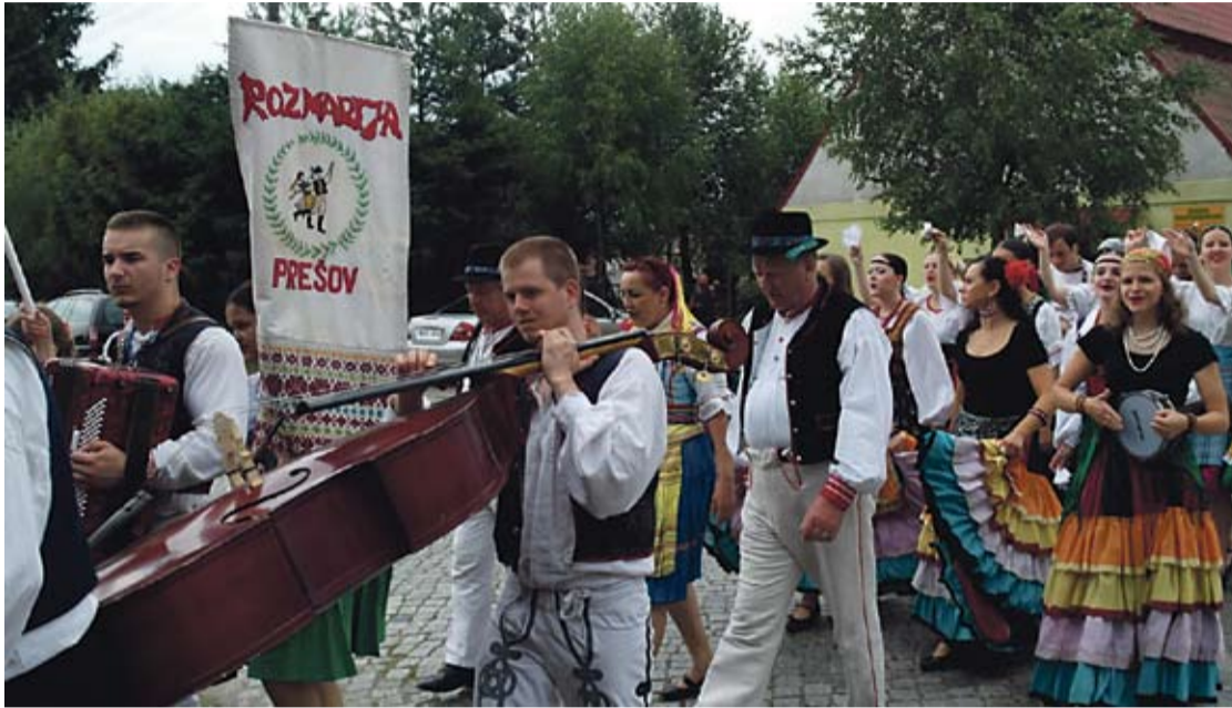
Grająco-tańcząco-śpiewający korowód w drodze do parku.

Tegoroczna 17 edycja festiwalu odbywała się pod tytułem „Kyczerka i jej goście dla Radwanic”. I rzeczywiście już przed południem festiwalowi artyści pojawili się w kilku miejscowościach gminy: Szkoła Podstawowa w Radwanicach gościła zespół „Deti Gór” z Osetii, w Buczynie prezentował się „Atarazu” z Kostaryki, do Sieroszowic przyjechał legnicki zespół „Kyczerka”, Kłębanowice gościły „Rozmarija”