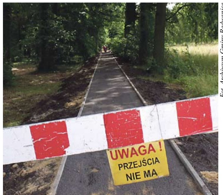
Kolejna drogowa inwestycja obejmuje alejkę łączącą Radwanice z Łagoszowem. Tu także powstanie chodnik z kostki. Zadanie – za kwotę 62 tys. zł – realizowane jest z budżetu gminy.