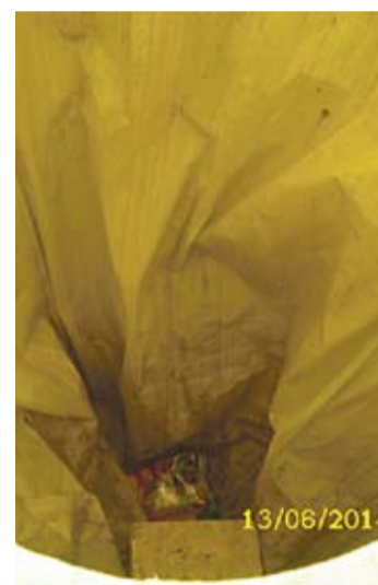
Ulica Nagietkowa w Polkowicach, 16 czerwca br. Użytkownikom tego PSZOK-u nie chciało się podnosić kłap pojemników, choć – jak widać – pojemniki były w środku puste.