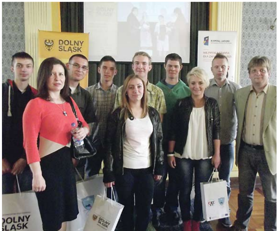
Przemkowscy laureaci z nagrodami.

Koniec roku akademickiego w Przemkowskim Uniwersytecie Trzeciego Wieku.