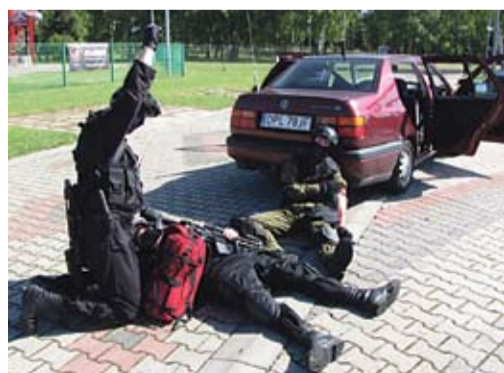
Zadanie z udziałem antyterrorystów było w zgodnej opinii uczestników mistrzostw najtrudniejsze.