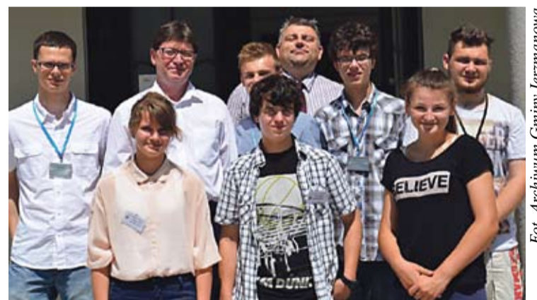
Utalentowana ekipa z Jerzmanowej, uczestnicząca w tegorocznej gali.