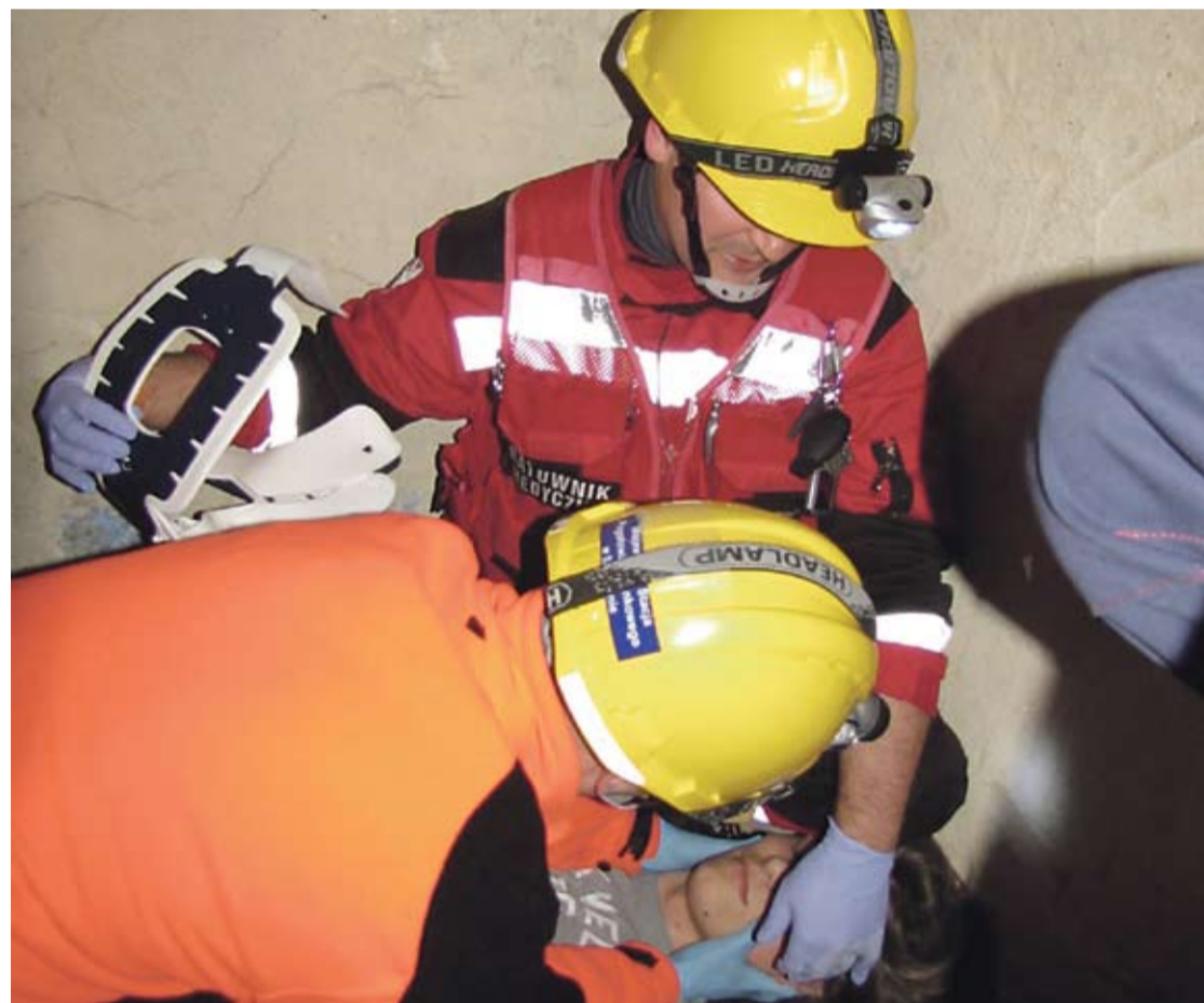
Zadanie w Stacji Ratownictwa Górniczego w Sobinie wymagało umiejętności poruszania się w mocno ograniczonej przestrzeni.