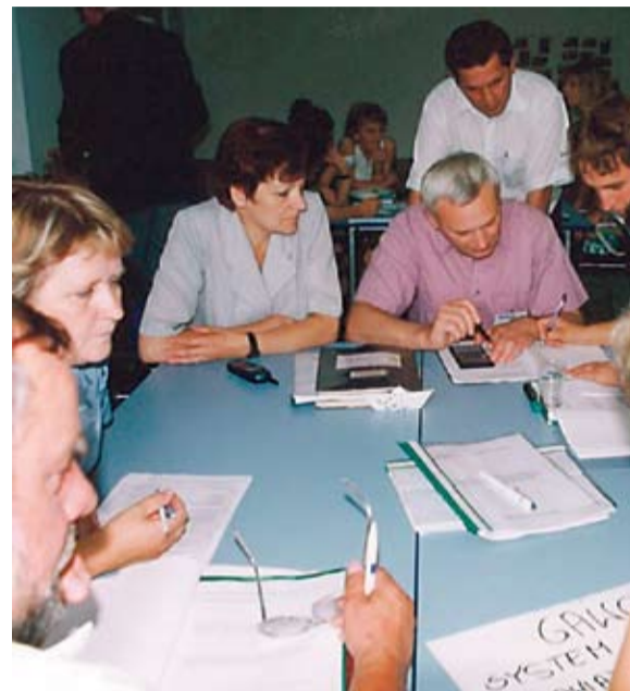
O śmieciach dyskutowaliśmy już przed dekadą. Tu: podczas warsztatów w Radziny.