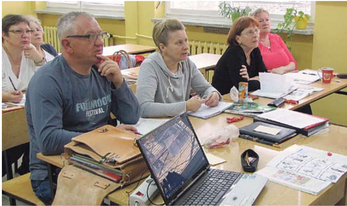
Studenci z PUTW podczas zajęć...

W Polkowickim Uniwersytecie Trzeciego Wieku spełniają się marzenia. Na zajęciach panuje wspaniała atmosfera, studenci po czterdziestce są otwarci na nowości, chętnie się uczą, nawiązują wartościowe kontakty, stawiają czoła wyzwaniom stawianym im przez wykładowców. Zakończony 17 czerwca rok akademicki jest już ósmym rokiem działalności PUTW. W gronie uczestniczących w zajęciach jest spora grupa osób, które od samego początku uczestniczą w zajęciach i dziś nie wyobrażają sobie życia bez PUTW.