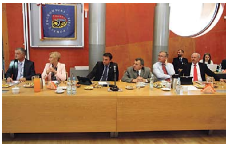
W trakcie posiedzenia wspominano początki powiatów w Polsce.

którzy dziś czują dumę z tego, że powiat polkowicki ma się dobrze.