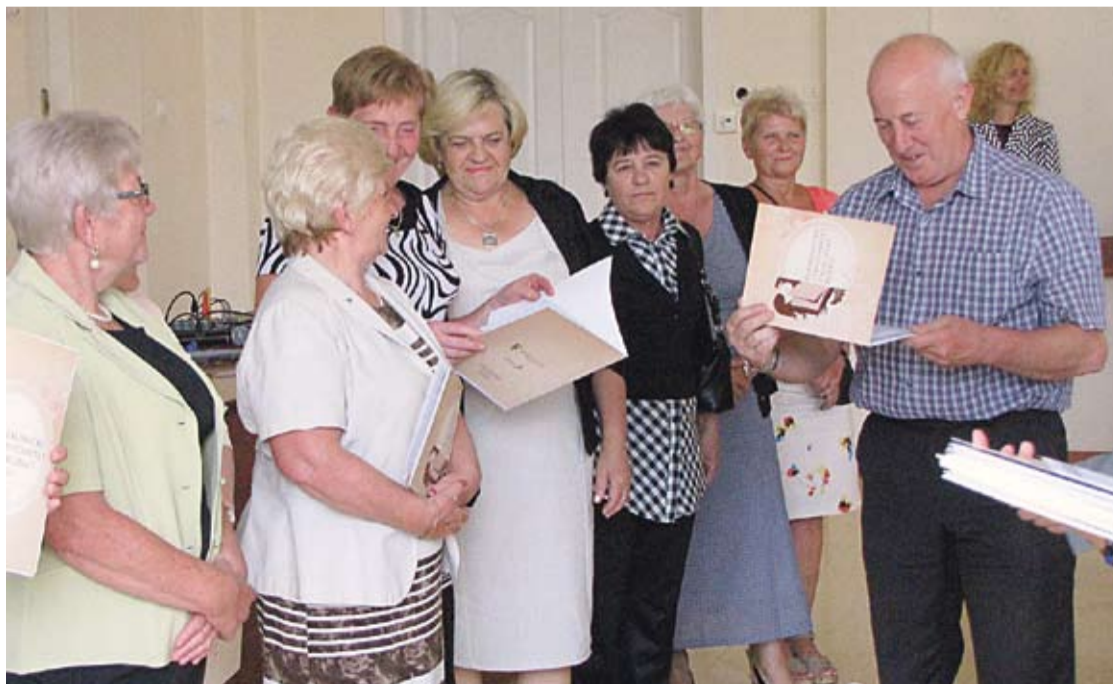
...i w trakcie odbierania dyplomów ukończenia kolejnego semestru.