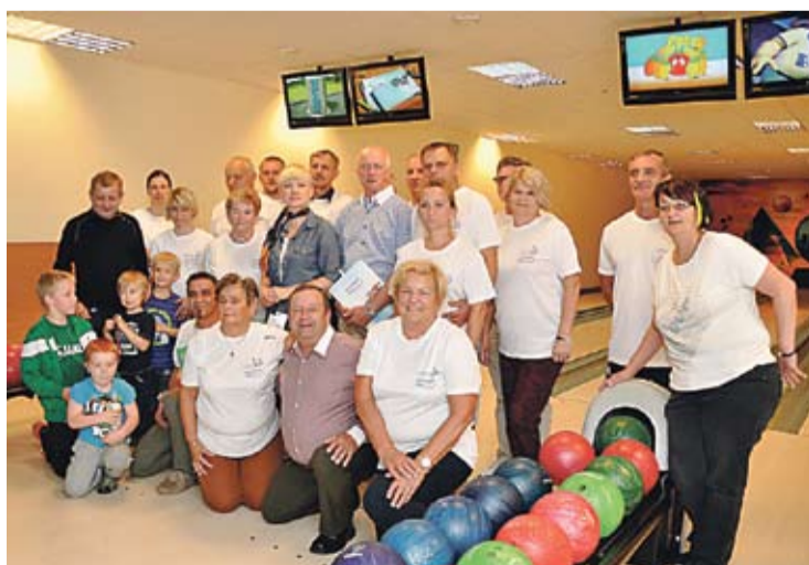
Pamiątkowe zdjęcie uczestników pierwszych zawodów.

5 lipca mieszkańcy Osiedla Gwarków będą się bawić na rodzinnym pikniku.