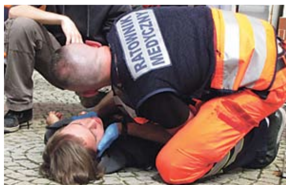
Takie obrazki można było oglądać 30 maja w polkowickim Rynku.

Podczas ostatniej sesji Rady Powiatu najważniejszym punktem było głosowanie nad udzieleniem absolutorium Zarządowi z wykonania budżetu za rok 2013