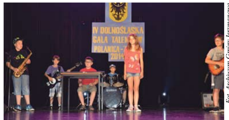
„Jezzmanowa” na polanickiej scenie.