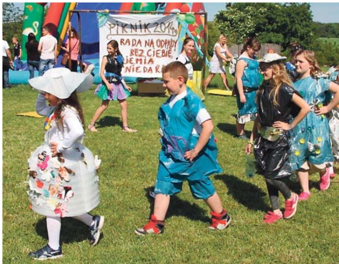
Jak widać, śmieci nie zawsze muszą trafić wprost na wysypisko.

W ostatnią sobotę maja boisko Szkoły Podstawowej w Parchowie wypełniło się uczniami, nauczycielami, rodzicami i zaproszonymi gośćmi. Wszyscy uczestniczyli w pikniku, odbywającym się pod hasłem „Segreguj odpady: Bez Ciebie Ziemia nie da rady”.