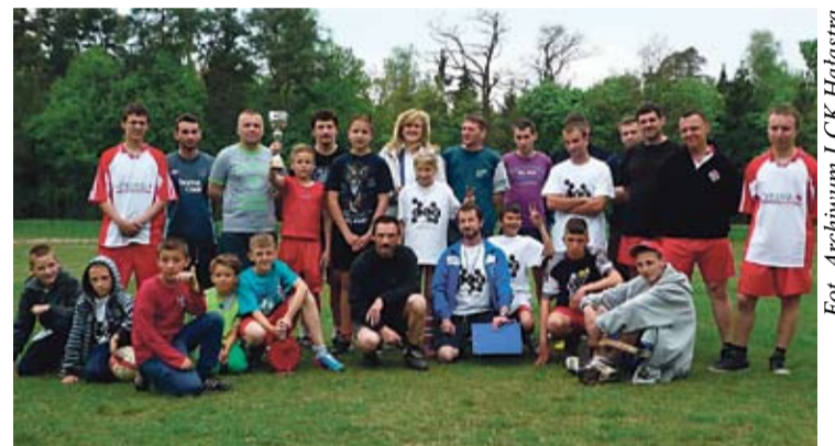
Po dwóch rundach ligi na prowadzeniu utrzymują się „Czarne Konie”, za nimi „Wodoleje” OSP ex aequo z LCK Hałastrą i „Dziećmi Kukurydzy”. Na kolejnych miejscach plasują się „Białe Konie”, „Warianty”, MDP oraz Młodzieżówka LCK i OSP.