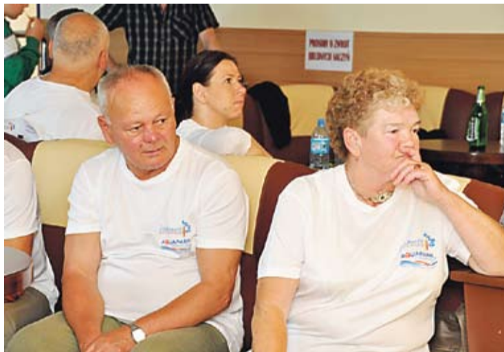
Zawsze dobrze popatrzeć na umiejętności innych...