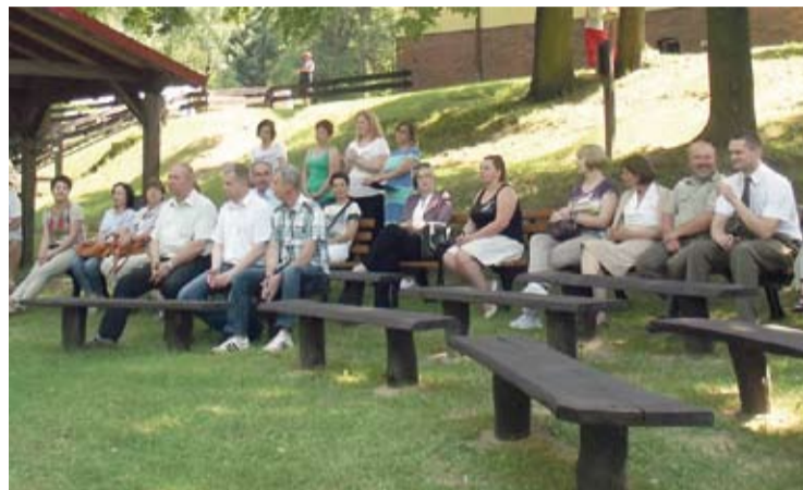
Podczas otwarcia Edukacyjnej Ścieżki Przyrodniczej goście byli pod wrażeniem tego, co udało się zrobić.