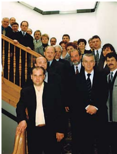
Po jednym z posiedzeń Zgromadzenia...