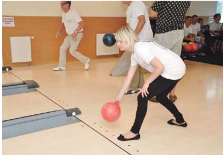
Panie bez kompleksów wobec zawodników płci męskiej sięgały po kulę i rzucały w piny.