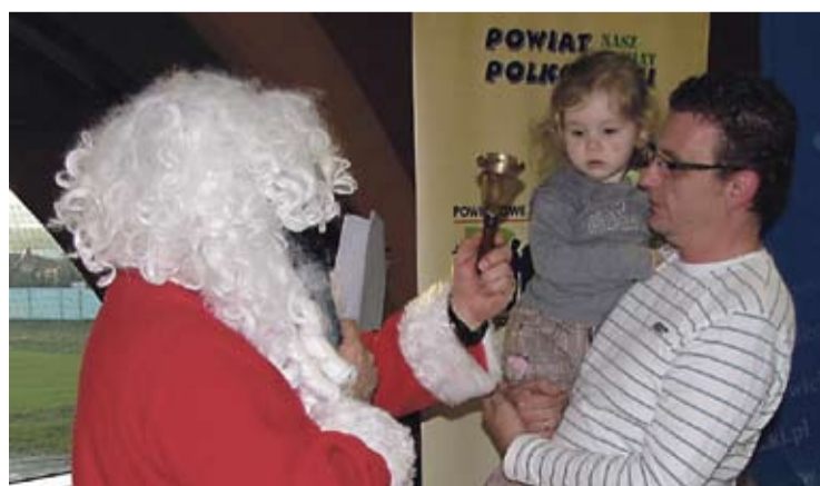
Święty Mikołaj obdarował prezentami wszystkie dzieci.

Uczniowie Zespołu Szkół w Chocianowie wraz z pracownikami Volkswagen Motor Polska w Polkowicach spotkali się z niemiecką młodzieżą, uczącą się w firmie Volkswagen w Chemnitz, Zwickau i Wolfsburgu.