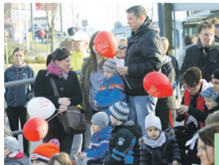
W oczekiwaniu na losowanie nagród.