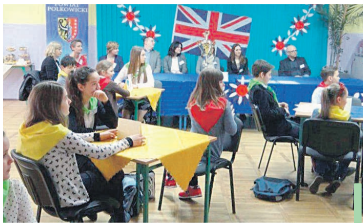
Uczestnicy konkursu podczas rozwiązywania zadań.