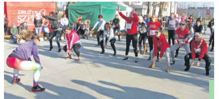
Przed biegiem obowiązkowa rozgrzewka.