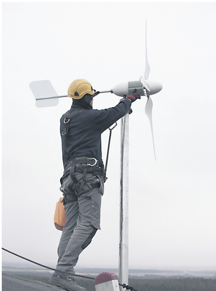
Zainstalowana na dużej wysokości turbina wiatrowa wytwarza energię, która zasila urządzenia radiowe, a jej nadmiar gromadzony jest w akumulatorach.