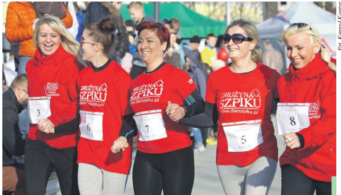
Drużyna Szpiku zawsze razem, także podczas Biegu na Obcasach.