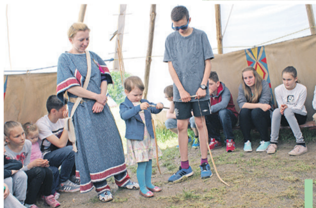
W indiańskim wigwamie dzieci poznawały tradycyjne narzędzia rolnicze.