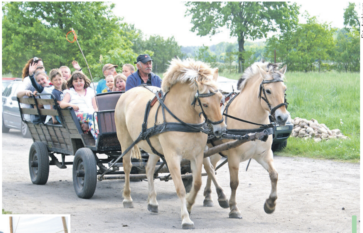
Przejażdżka bryczką była jedną z głównych atrakcji pikniku.

Dla najmłodszych z okazji ich święta pracownicy Powiatowego Centrum Pomocy Rodzinie w Polkowicach przygotowali moc atrakcji.