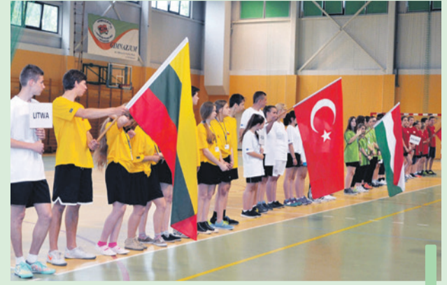
Na zakończenie pikniku odbyły się zawody sportowe.

W trakcie uroczystości starosta polkowicki wręczył symboliczny czek na wycieczkę dla zwyciężskich klas w konkursie z wiedzy ekologicznej o powiecie. Kor