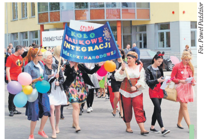
Barwny studencki korowód przeszedł ulicami Polkowic.