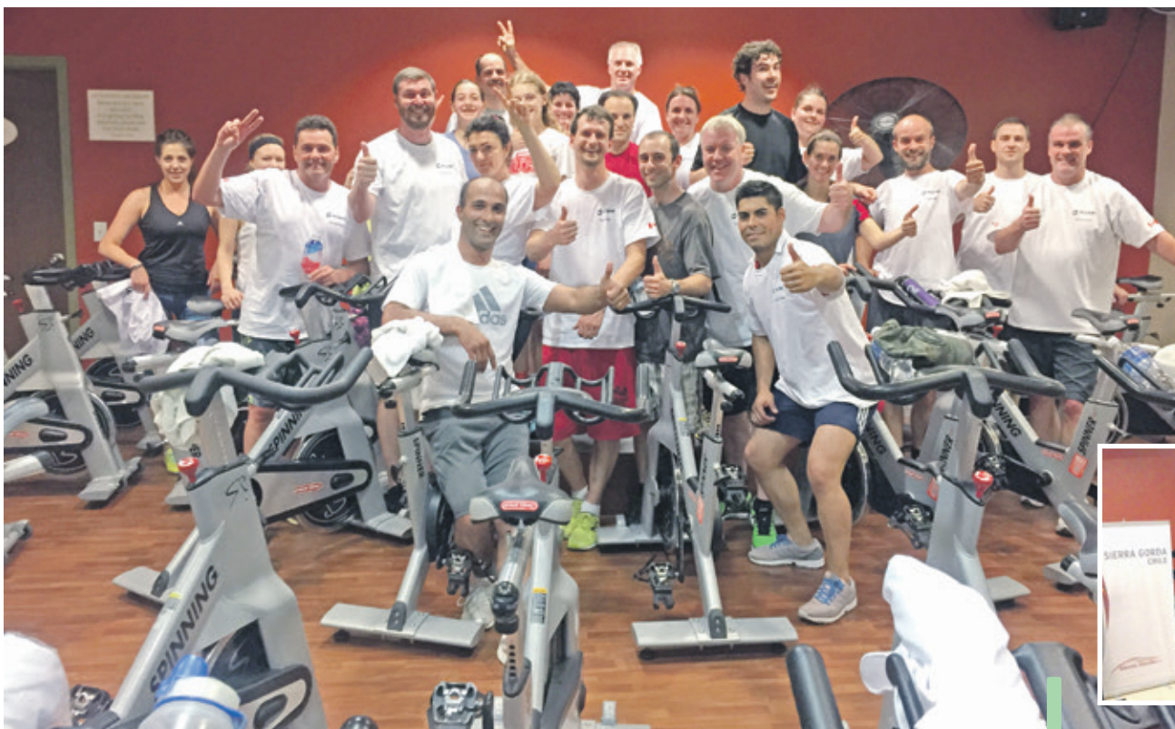
Ekipa w kanadyjskim Sudbury. Chyba jeszcze zanim wykręcili te 500 km...