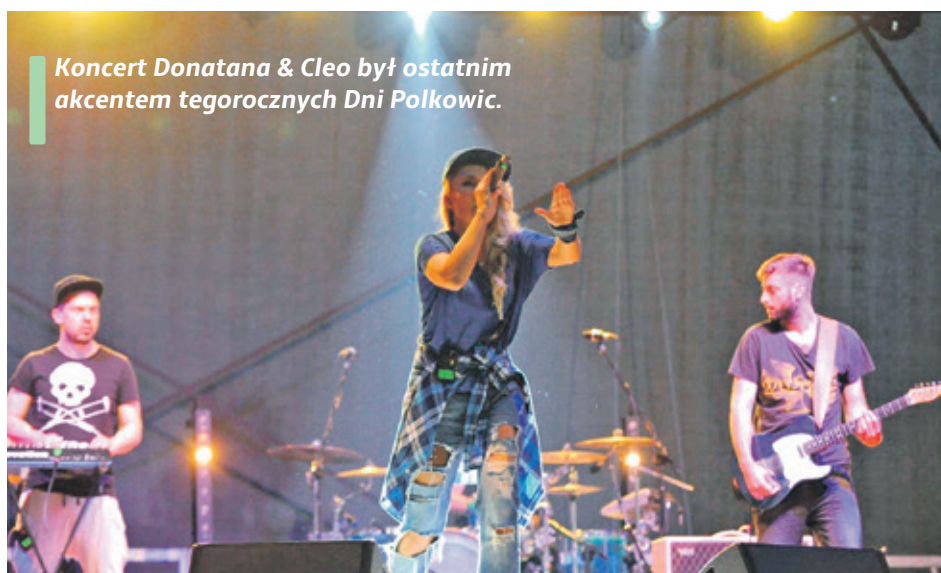
Koncert Donatana & Cleo był ostatnim akcentem tegorocznych Dni Polkowic.

Kabaret pod Wyrwigroszem także stanął na wysokości zadania. Zabawne skecze wywoływały uśmiech na twarzach widzów. Podobnie było podczas przyglądania się rywalizacji pomiędzy gminą Polkowice i powiatem polkowickim. W tym roku toczyła się ona wokół szeroko rozumianej służby zdrowia. Urzędnicy musieli wykazać się znajomością anatomii, czy też umiejętnością bandażowania. Na szczęście nie muszą się tym zajmować na co dzień, bo – szczerze powiedziawszy – potencjalni pacjenci mieliby spore problemy. W rywalizacji z przymrużeniem oka tym razem górą było starostwo powiatowe, które tym samym w kilkuletniej ry-