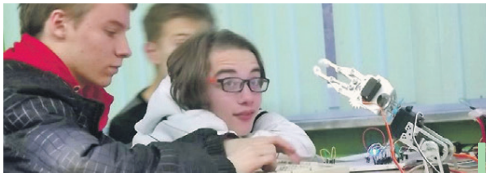
Robot-ręka – zwycięska praca młodych konstruktorów.