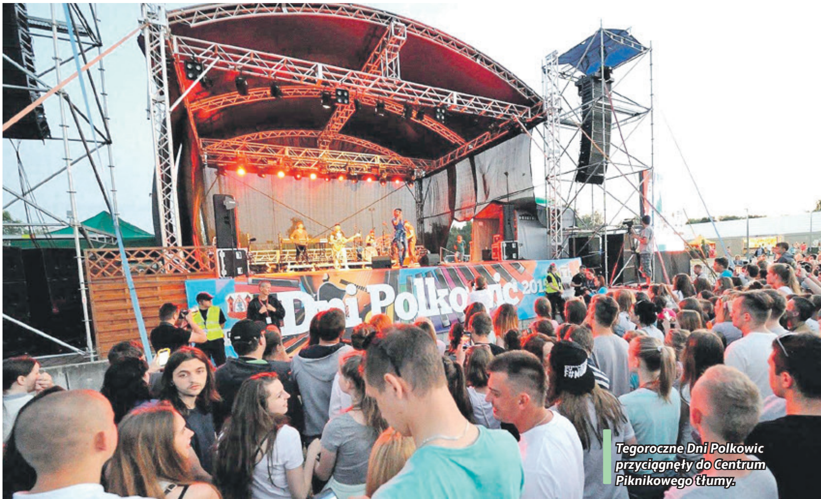
Tegoroczne Dni Polkowic przyciągnęły do Centrum Piknikowego tłumy.

Drugiego dnia pogoda była już o wiele łaskawsza dla organizatorów tegorocznych Dni Polkowic.