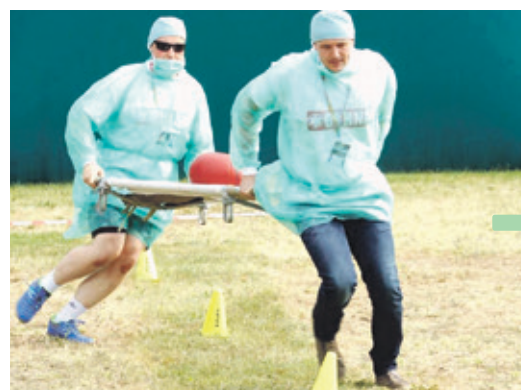
Urzędnicy gminni i powiatowi musieli się wykazać nie tylko wiedzą medyczną, ale także sprawnością fizyczną.