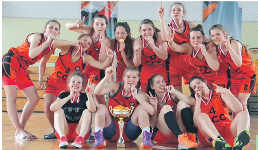
Złoty zespół koszykarek polkowickiego Zespołu Szkół w pełnej krasie.