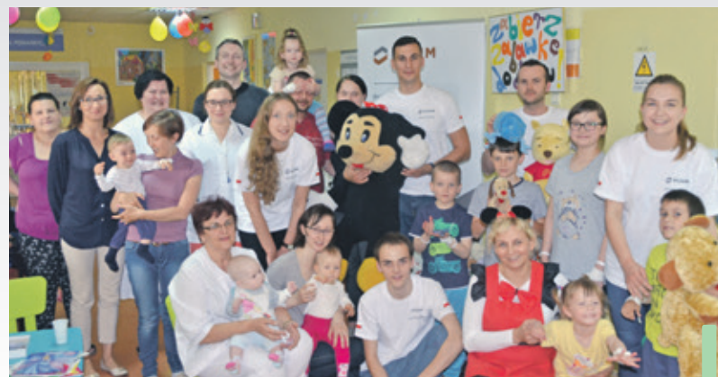
Dzięki wspólnej zabawie z gośćmi ten dzień w szpitalu minął młodym pacjentom na pewno milej.