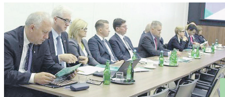
Szefowie gmin z naszego regionu na spotkaniu na temat przyszłości miedziowej spółki.

Poruszono także tematy powiększania zbiornika Żelazny Most, uciążliwości związanych z wydzielaniem się siarkowodoru z szybu Św. Jakub oraz wykorzystania linii kolejowych Pol – Miedź Trans do publicznego