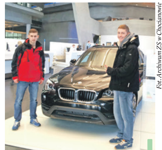
Pamiątkowe zdjęcia uczniów przy jednym z nowych modeli samochodów BMW.