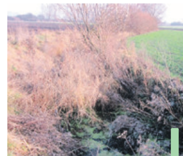
Na terenie gminy trzeba oczyścić 5555 m rowów melioracyjnych.

W ostatnim czasie gmina Pęcław została beneficjentem jeszcze jednej darowizny: Fundacja Polska Miedź dofinansuje kwotą 80 tys. zł budowę szerokopasmowej sieci teleinformatycznej. (mb)