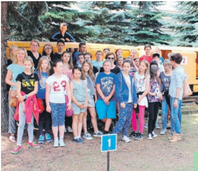
Wspólna fotografia uczestników wymiany.