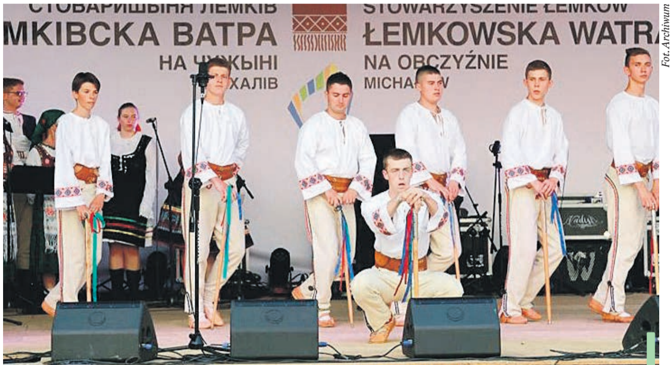
Występy łemkowskich zespołów wzbudziły powszechny entuzjazm widzów.

Impreza odbywa się pod honorowym patronatem wojewody dolnośląskiego i starosty polkowickiego.