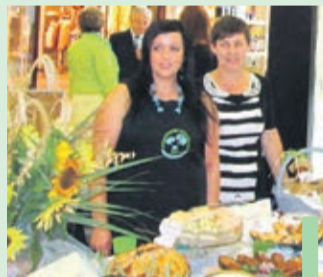
Konkursowe dania i specjalty wystawiono 20 sierpnia w Pasażu Grunwaldzkim.