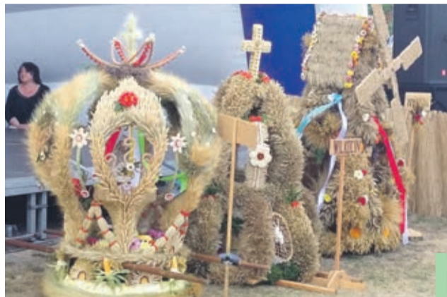
Dożynkowe wieńce. Pierwszy z lewej – ten najpiękniejszy.

Najpiękniejszy wieniec – po raz kolejny z rzędu – uplotły Szklarki.