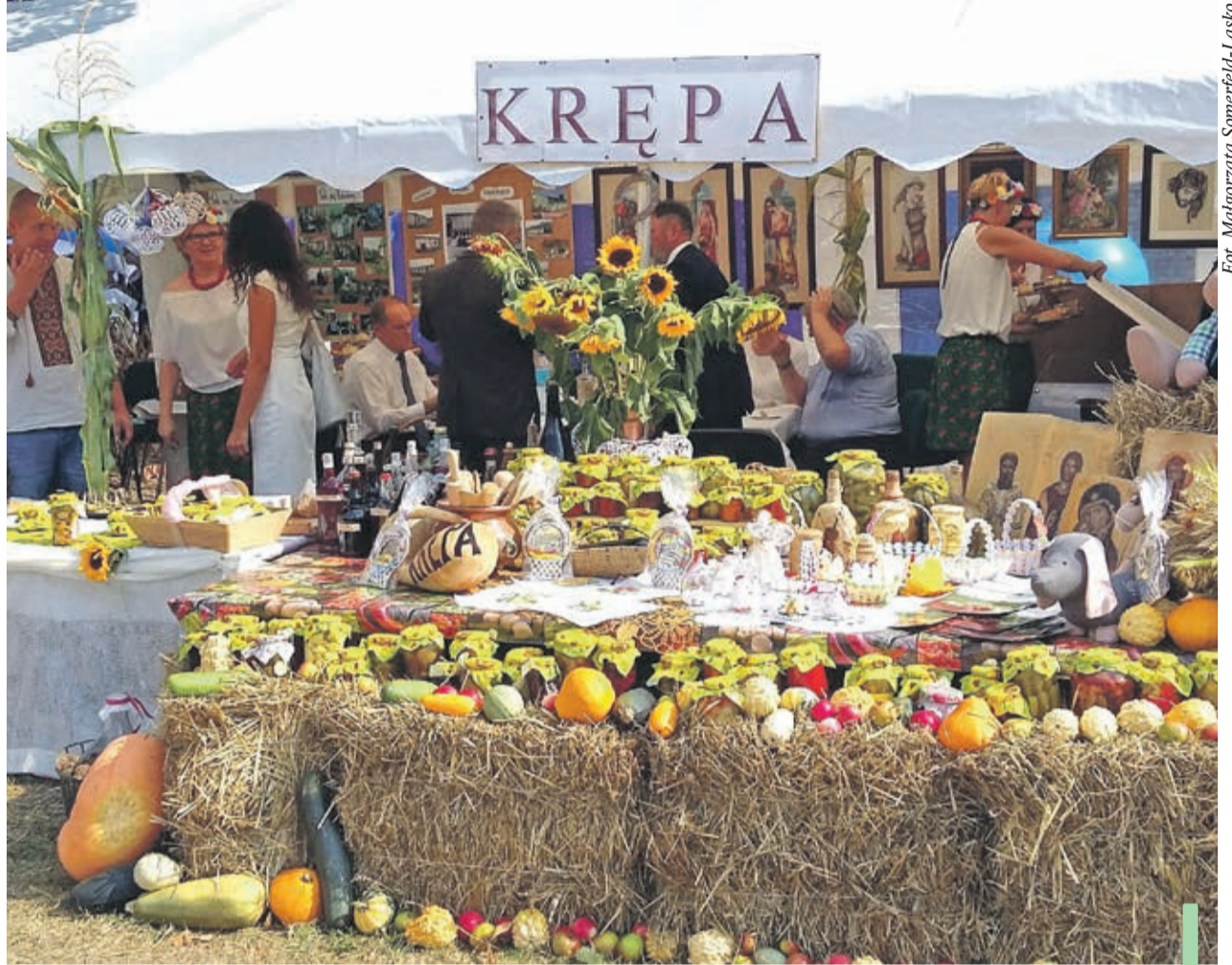
Krępa przywitała dożynkowych gości suto zastawionym stoiskiem.