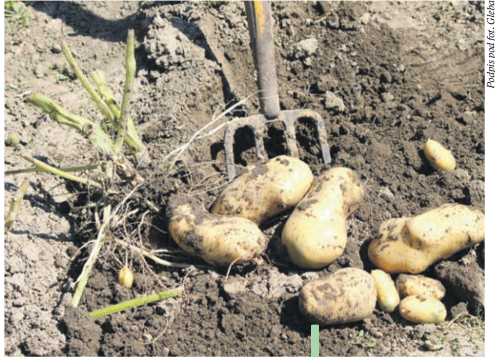
Podpis pod fot. Gleba

– Myślę, że około 90% gleb będzie się nadawało do wapnowania – stwierdziła Justyna Kozłowska. Jak zauważyła, ziemia obecnie – zwłaszcza na terenach górniczych – mają „słabe pH”, czyli są