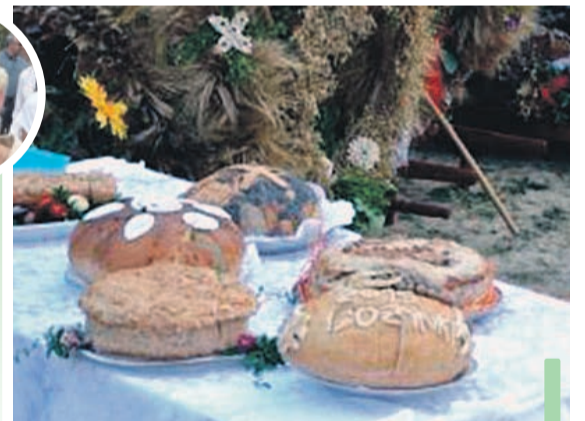
Bochny zgodnie ze zwyczajem poświęcono, pokrojono i rozdano wśród gości.