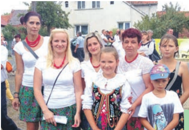
Panie z Wioski Czerwonego Kapturka przygotowały przyśpiewki, w których „dostało” się i włodarzom gminy, i policji, a nawet służbie zdrowia. Fragment powyżej.