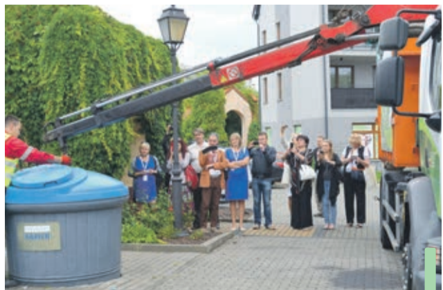
Wizyta ukraińskich samorządowców odbywała się w ramach Polsko-Kanadyjskiego Programu Wsparcia Demokracji. Projekt finansują ministerstwa spraw zagranicznych obu krajów.

Pytania dotyczyły w zasadzie wszystkiego, co związane jest z gospodarką odpadami: ile kosztowało utworzenie systemu, ile wybudowanie CPSZOK-u, jak prowadzona jest edukacja wśród mieszkańców, jak wyglądała budowa Osiedlowych PSZOK-ów, czy ludzie chcą segregować odpady. (mb)