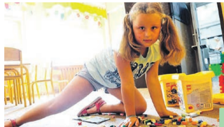
Układanie klocków też sprawia dużą frajdę.

Do końca wakacji z półkolonii organizowanych teraz przez SP 1 skorzysta ponad setka dzieci. Tak duża frekwencja potwier-