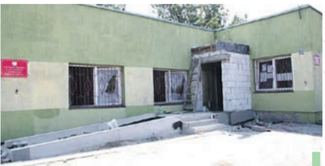
Nowe wejście do świetlicy w Krzydłowicach.